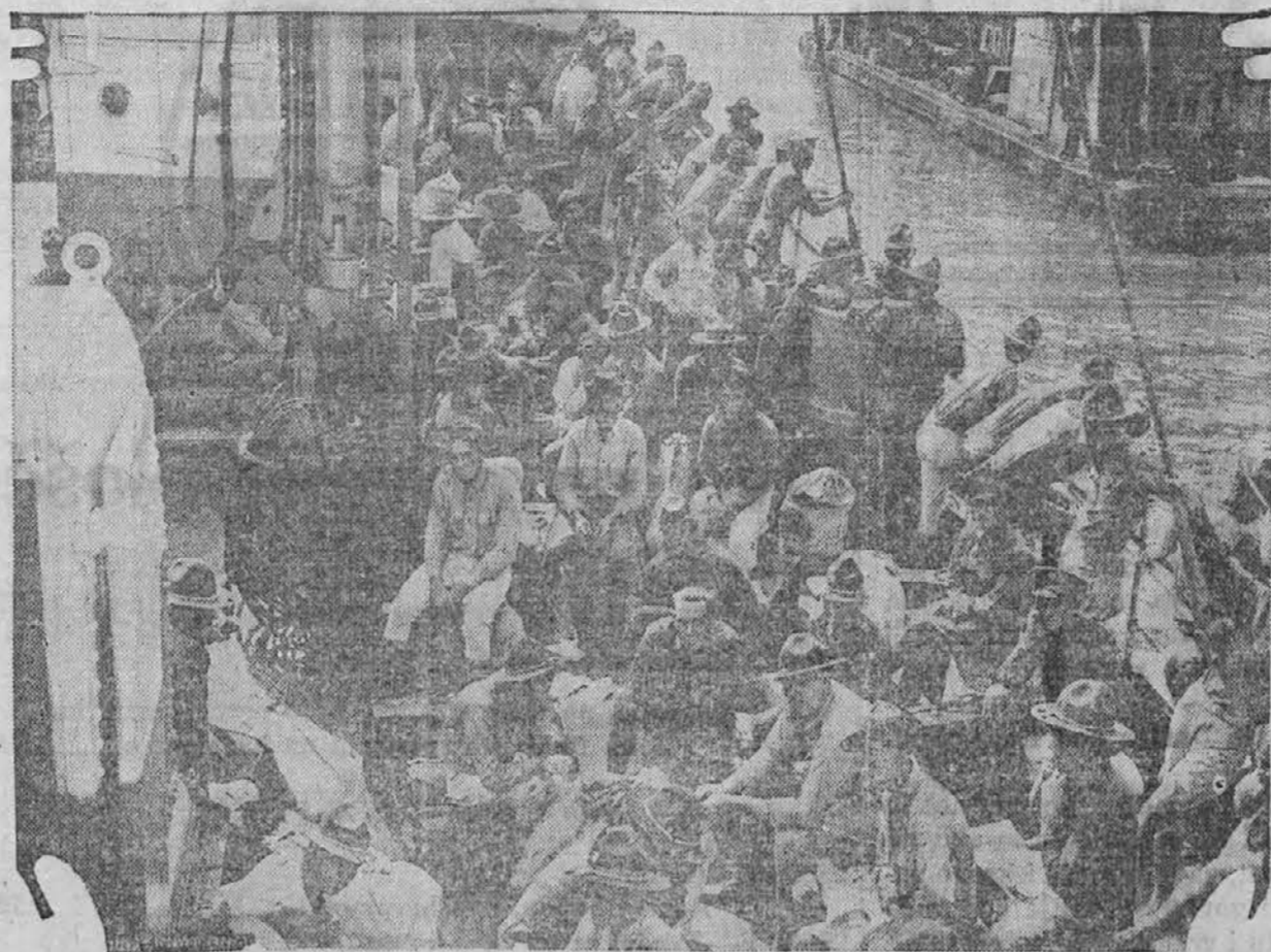
Slika nam kaže moštvo armade Zedinjenih držav, ki se po triletni vojaški službi v Panama vračajo v svojo ameriško domovino.

vila strahovita toča v brdih in okoli Gorice in nekoliko v gorah. Trta ki je posebno lepo kazala je popolnoma uničena. Grozdje in mladika je vse na tleh. Po nekaterih krajih je dosegla toča debelost kurjega jajca.