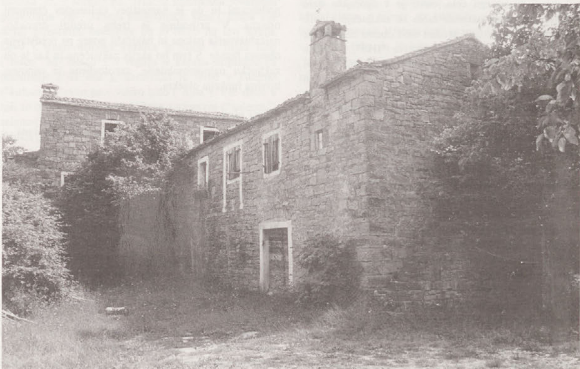
Domačija "Grundali" v osrednjem delu vasi

Kljub večdesetletni zanemarjenosti nam celota še vedno razkriva slikovito podobo tradicionalne istrske vasi. Pot do Abitantov vodi po nekoliko zapuščeni, še neokrnjeni pokrajini. Spremlja jo podporni zid iz lepo zloženega peščenjaka, ki ga mestoma prekinjajo vdolbine napajališč za živino. Vas odlikuje zanimiva urbanistična