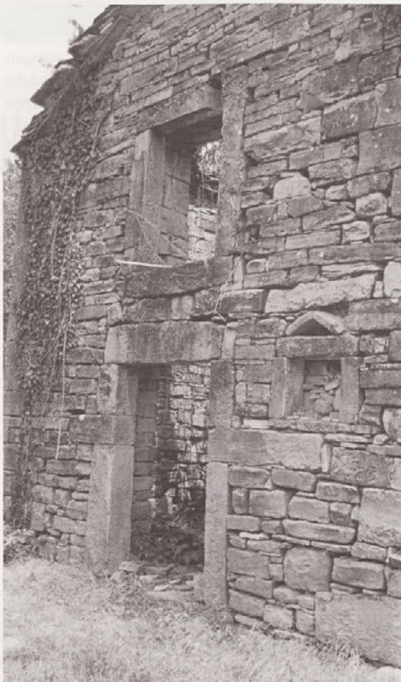
Hlev v vzhodnem delu vasi, ki pripada domačiji "Grundali".

Kot kaže, pa se bodo v Abitantih stvari vendarle zasukale drugače. Vas je bila zadnja leta večkrat omenjena v javnih medijih. Pozabljeno in propadajoče naselje so poleg pristojnih strokovnih služb začeli opazati tudi umetniki, novinarji in številni posamezniki, ki jih je prevzela enkratna lepota vasice, ležeče sredi neokrnjene pokrajine. Daleč najbolj vzpodbudno pa je dejstvo, da so se začeli za obnovo vasi zanimati njeni odseljeni "abitanti" (beseda pomeni v ital. "prebivalci"). Slednji je pravzaprav niso nikoli pozabili. Prva generacija, ki je odrasla izven vasi, si je do danes zagotovila existenco in ima sedaj možnost, da se usmeri v obnovo starih domačij. Mnogi lastniki so se zbrali, da pred propadom rešijo svoje prve domove, kjer so preživeli najzgodnejša otroška leta. Do tega trenutka se