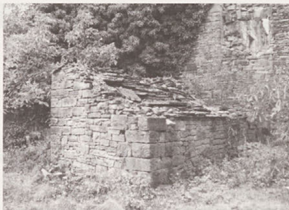
Svinjak s kamnito kritino.

Vsekakor bi revitalizirana vas ob celoviti ohranitvi njene