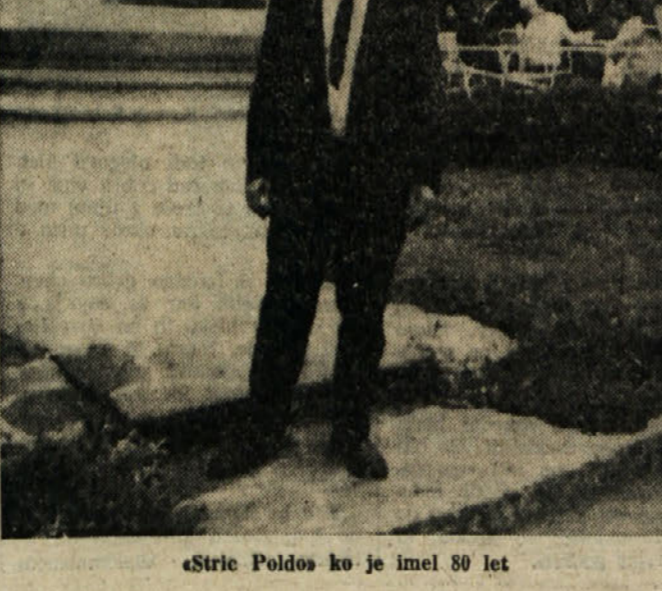
Stric Poldo ko je imel 80 let