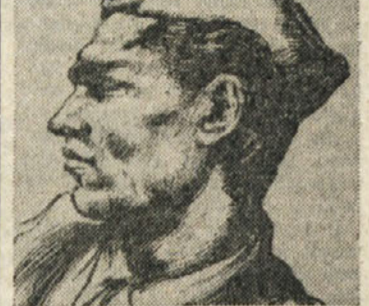
Brinovem griču pa je postala tudi zbirna baza prostovoljcev, ki so prišli v partizane, odkoder so jih odpredeljali na Notranjsko in Dolenjsko.

Taborišče je bilo na Brinovem griču v objemu močnih smrek med naselji Koševnik, Predgrize in «francoski cesto», oddaljeno od vasi Idrijski log z glavne ceste le dvajset minut hoje po gozdni poti ali pol ure od vasi Predgrize pri Črnem vrhu nad Idrijo.