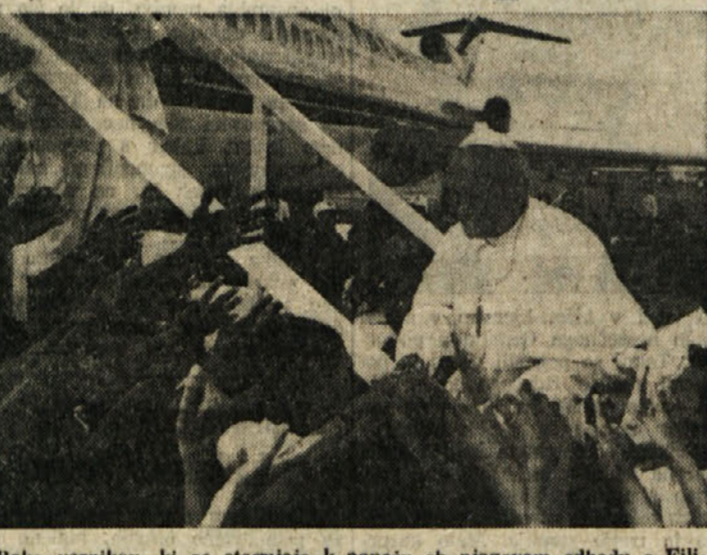
Roke vernikov, ki se stegujejo k papirju ob njegovem odhodu s Filipinov, izražajo upanje močje zatiranih in zastavljenih v Aziji