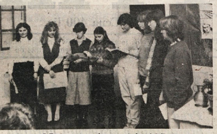
S Prešernove proslave na strokovni šoli