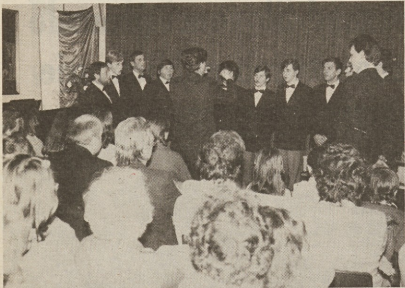
KD Slovenec iz Boršta in Zabrežca je v soboto ob splošnem navdušenju občinstva ponovilo zabavno predstavo, na kateri so mladi vaški kulturni delavci uprizorili tudi uspelo narečno komedijo »Kabaret 1999«. Na sobotni prireditvi je kot gost nastopil tudi moški pevski zbor »Skala« iz Gabrij (na sliki)