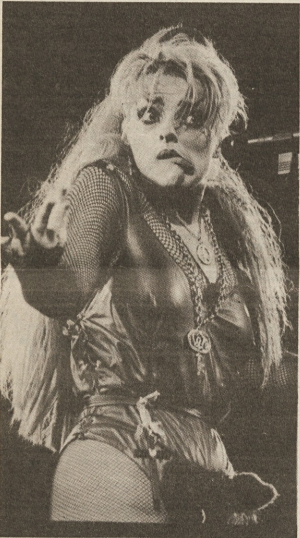
RIO DE JANEIRO — Zahodnonemška rock-zvezda Nina Hagen se je takole spakovala na zaključnem koncertu rock glasbe v Rio, največji glasbeni prireditvi vseh časov.