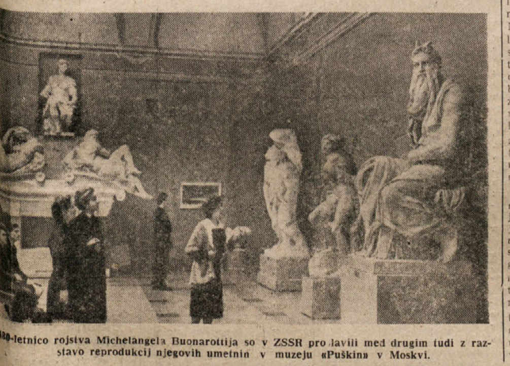
Letnično rojstva Michelangelova Buonarrotija so v ZSSR proslavili med drugim tudi z razstavo reprodukcij njegovih umetnin v muzeju 'Puškina' v Moskvi.