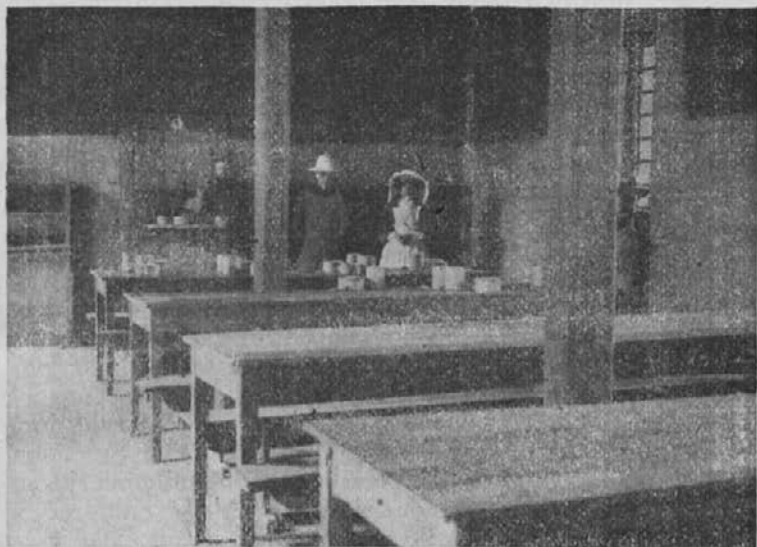
Obednica gobavcev v Fianarantsoa (Madagaskar).