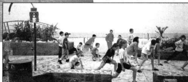
...pri jutranji telovadbi