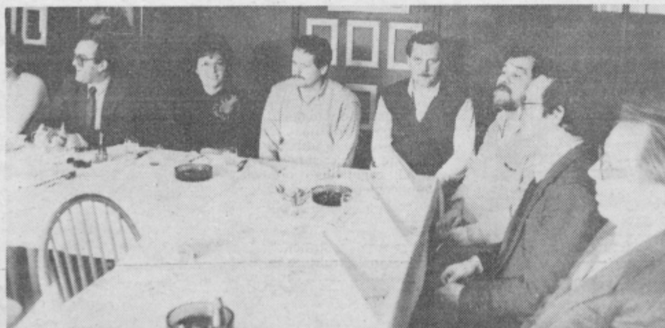
Novinarji na sprejemu v Žalcu

desetimi predsedniki krajevnih konferenc socialistične zveze je 6 komunistov. V organih sindikatov je od 196 predstavnikov 79 komunistov. Drugačno je razmerje v ZSMS. V občinsko organizacijo ZK je vključenih 28 mladincev, v občinski konferenci ZSMS pa so le trije člani ZK. Med 67 borcev je 29 članov ZK. V družbenopolitičnem zboru skupščine je med 20 delegatov 16 članov, v zboru krajevnih skupnosti je od 97 delegatov 20 članov ZK, v zboru združenega dela pa med 198 delegatov 28 članov ZK. V sish so med 566 delegatov 104 člani ZK. Mozirski komunisti bolj kot številčnosti dajejo poudarek vsebini dela.