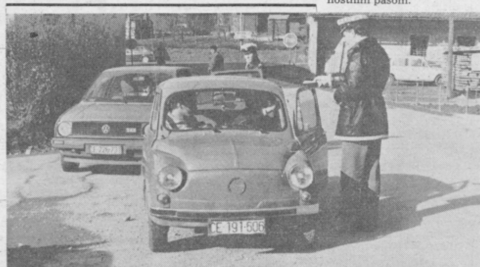
Tudi patrulja Postaje prometne milice Celje, ki je ustavljala vozila v Šentjurju, je imela dovolj dela s pobiranjem mandatnih kazni.

Sojenje so prejšnjo sredo prekinili in nadaljevali včeraj (v sredo, 25. januarja), torej po zaključku naše redakcije, zato bomo o njem poročali v naslednji številki. S.S.