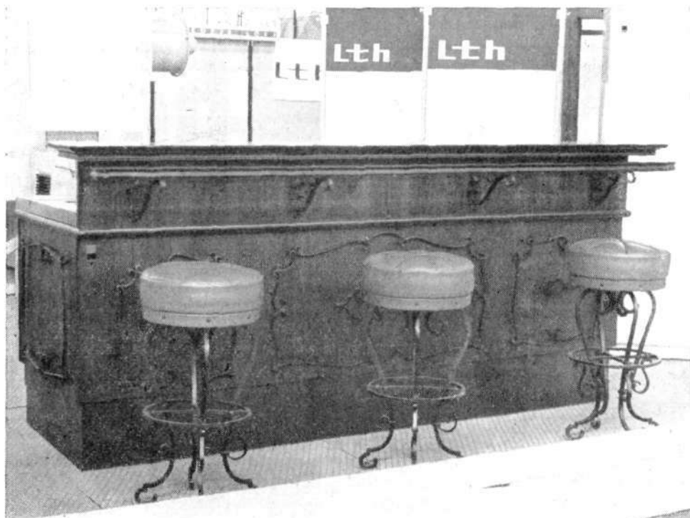
Hladilni pult tipa barok

Telefon: 85 091 Telegrami: Elteha Škofja Loka Telex: 345-19 YU-LTH