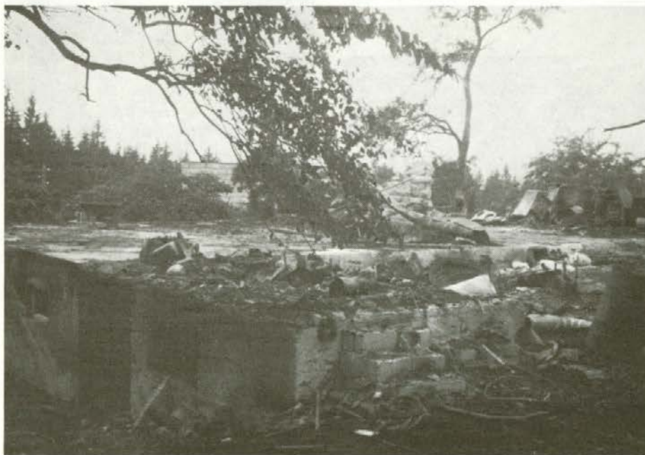
Ostalo je golo zidovje in uničeni kmetijski stroji