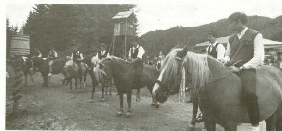
Štehvanec so se takole pripravili na štehvanje