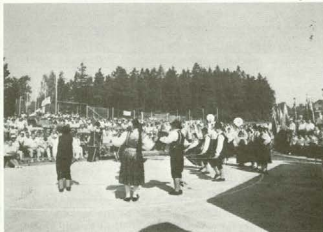
Folklorna skupina iz Podgorja med nastopom na Graški gori.