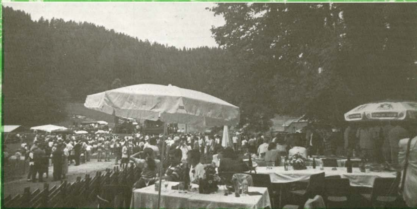
Mogočna Najevska lipa na Ludranskem vrhu nad Črno je letos že tretjič gostila vse, ki so prišli pod njene nederje. Letos je k lipi prišlo mnogo manj povabljenih državnikov in gostov pa tudi samih korošcev je bilo malo. Ali to srečanje pri Najevski lipi ni več tako zanimivo, kot je bilo prvo, drugo ...?