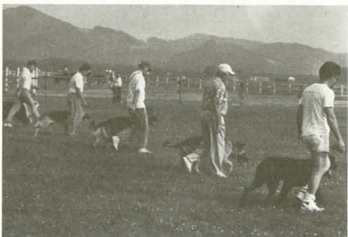
Tudi člani Kinloškega društva Slovenj Gradec so imeli svoj dan v Turiški vasi