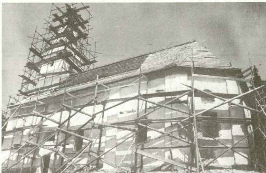
Obnova cerkve sv. Danijela