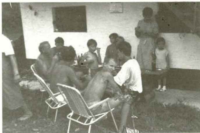
Po vročem dnevu in po končanem spravilu sena, ko pridejo na pomoč tudi sosede, se prilže oddih v senci ob izdatni malici in medsebojnem pogovoru.