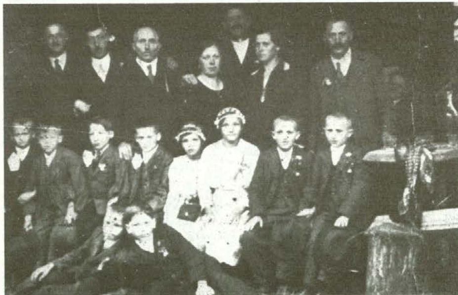
Razborški birmanci in botri v Podgorju 16. junija leta 1937.