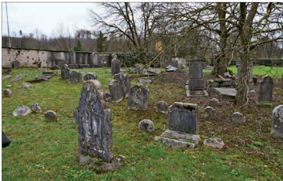
Pogled na notranjost judovskega pokopališča.

Po razmejitvi med Jugoslavijo in Italijo septembra 1947 je mesto Gorica ostalo v Italiji, po odločitvi tedanjih vodilnih jugoslovanskih političnih oblasti pa so začeli sredi leta 1948 graditi novo mesto, Novo Gorico. Del grobov z judovskega pokopališča so premaknili v vzhodni kot pokopališča, ko so trasirali novo cestno povezavo z nastajajočim mestom. Na Goriškem krožijo govorice, da je imela tedanja slovenska oblast ob koncu štiridesetih let namen judovsko pokopališče v Rožni Dolini kar prekopati oz. odstraniti zaradi izboljšanja cestnih povezav v novo-