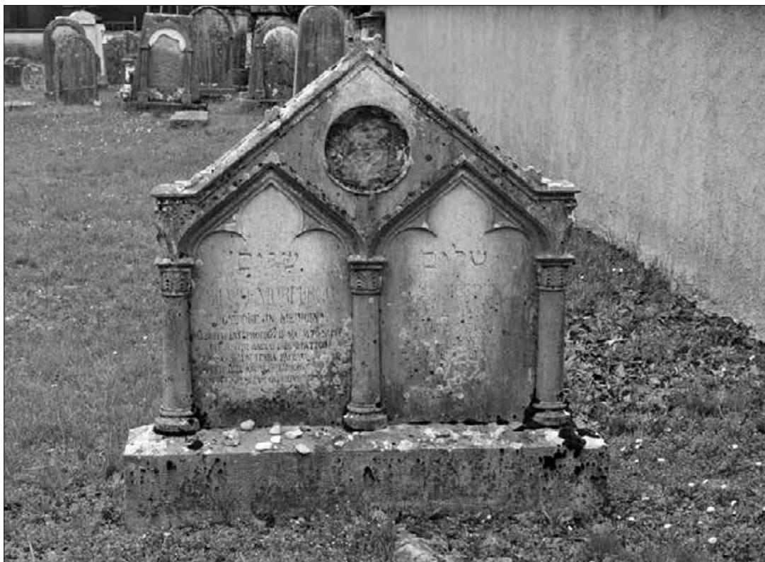
Nagrobnik članov družine Morpurgo.

dvojezične napise, hebrejske in nemške oz. hebrejske in italijanske. Vsak nagrobnik na pokopališču v Rožni Dolini je imel svojo številko, ki je bila vklesana v nagrobni kamen. Na njih pogosto najdemo različne simbole, ki označujejo posamezne judovske družine: dvignjene roke v znak blagoslavljanja, združene v palcih, duhovniška družina (Coen); vrč, iz katerega voda teče v umivalnik (Levi); golob (Jona); petelin z ječmenovim klasom v kljunu (Luzzatto); velika riba, iz ust katere moli človek (Morpurgo); grb s simbolom besnega leva (Senigaglia); knjiga ali zvitek Tore je simbol za grob učenjaka. Nekateri nagrobniki so žal izginili ob poplavih bližnjega potoka Vrtojbičica, ko pokopališče še ni bilo ograjeno z zidom. Nekatere nagrobnike pa je sčasoma prekrila zemlja, kajti talmud prepoveduje njihovo premikanje in dvigovanje. Na nekaterih nagrobnikih lahko vidimo tudi simbole, ki niso povezani z družino tam pokopanega: svetilka, granatno jabolko (simbol plodnosti), palmova veja (znak blagoslova in obnovitve), list akanta, etrog (citrona) ali venec kot znak modrosti in znanja. 21