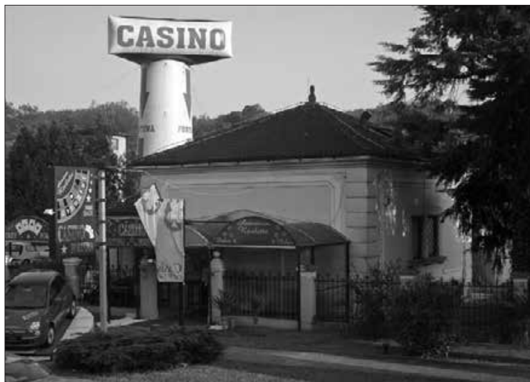
Pred desetletjem je v nekdanji judovski mrliški vežici domoval igralni salon.

šcev. Kot judovski sakralni objekt jo identificira lepo oblikovan obredni umivalnik. 49