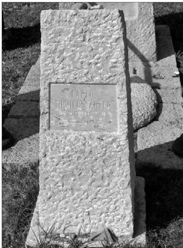
Nagrobnik filozofa Carla Michelstädterja.