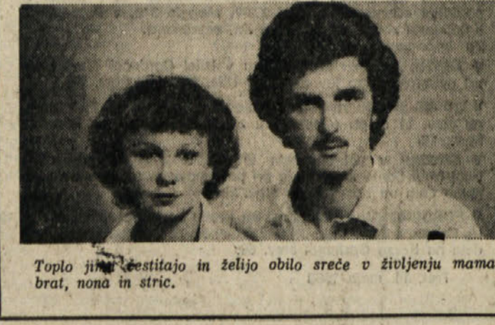
Toplo jim čestitajo in želijo obilo sreče v žiteljenju mama, brat, noma in stric.