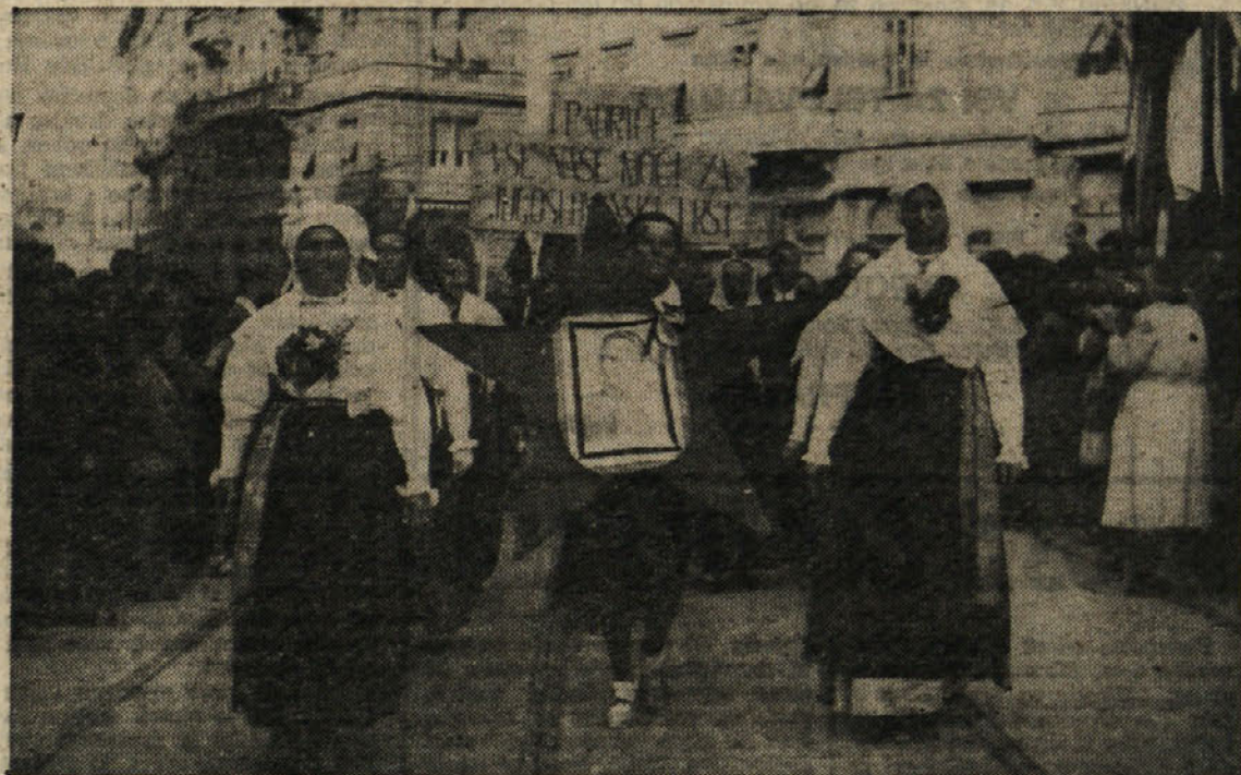
Naša prosvetna in kulturna društva so se z množičnimi prireditvami občuteno poklonila spomenu umrlega jugoslovanskega predsednika Tita. Ustanovitelj nove Jugoslavije je s svojimi idejami ter s svojo ustvarjalnostjo odločno pripomogel pri kulturni rasti vseh jugoslovanskih narodov in narodnosti. Prizadevanja predsednika Tita so tudi zgled vsem našim društvom, da nadaljujejo po njegovi poti pri izgradnji boljše bodočnosti. Gornja fotografija je bila posneta dne 15. oktobra 1945 in prikazuje žene v narodnih nošah iz Padrič, ki v sprevedu po tržaških ulicah nosijo sliko maršala Tita

Prepričanost, da smo Slovenci kot narod polnopravni državljani sveta, da je naša matična domovina na vseh področjih dela in znanja ter s svojim blagostanjem dežela z velikim ugledom v svetu, da so stališča, ki nam kratijo naše pravice, kot narodnostni skupnosti v Italiji, politično in kulturno zaostala, nam vliva danes že toliko samozavesti, da moramo iz nje narediti orožje za doseganje takšnega odnosa med tu živječima narodoma, ki bo slonel na prepričanosti, da je obojestransko globlje poznavanje v največjo korist vseh in edina možna pozitivna vloga ljudi na stičišču dveh kultur. Takšna pravilna, a za marsikoga še vedno skrajno revolucionarna vloga kulture v naših krajih pa mora biti izražena tudi v točni opredelitvi dela, ki si ga zastavljamo v našem odnosu do lastne kulture, do aktualnosti njenih izrazov in hotenj. V okviru naše zveze in njenih članic se je razvila diskusija o tem problemu. Izoblikovalo se je stališče, da mora odnos do kulture in njene vloge dobiti svoj izraz tudi v samem imenu naše zveze in naših društev. Naše pojmovanje kulture sloni na prepričanju, da mora biti kultura našega časa najbolj demokratični izraz človekovega življenja.