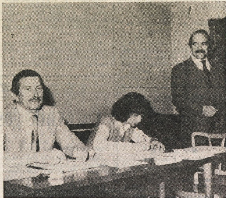
Predsedstvo rednega občnega zbora PD S. Škamperle

Skratka, prav bi bilo, da bi se kdo lotil načrtnega zbiranja takih značk in kolajn. M.W.