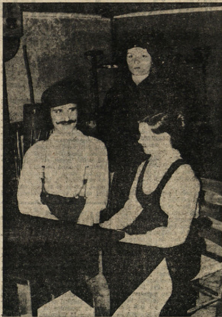
Člani «Beneškega gledališča» med uprizoritvijo Beneške ojetci