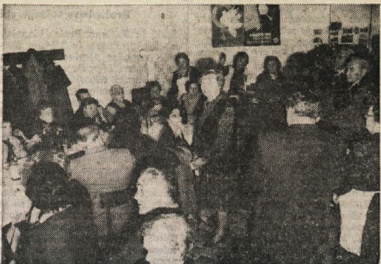
Mednarodni praznik žena so lepo praznovali tudi člani in članice PD Rovte - Kolonkovec

23. marca je društvo Rovte-Kolonkovec priredilo izlet v Caorle, 13. aprila pa so se izletniki podali v Mezzomonte, v bližini Pordenona.