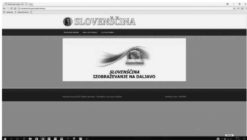
Slika 1: Primer dostopa do gradiv

Sama sem z vrhunskimi športniki delala v spletni učilnici Moodle, ker delo v njej obvladajo in na ta način delajo tudi pri drugih predmetih. Podobno