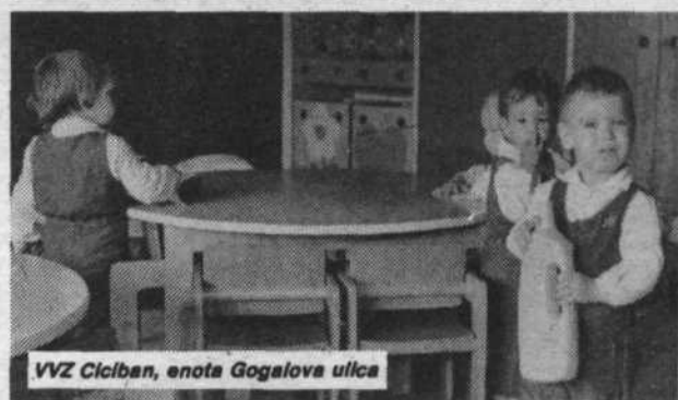
VVZ Ciciban, enota Gogalova ulica