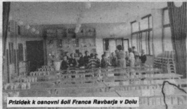
Prizidek k osnovni šoli Franca Ravbarja v Dolu