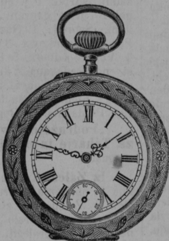
Srebrna ura z dvoj. pokrovom gld. 5.— s posebno močnim in najboljšim kolesovjem gld 7.50,