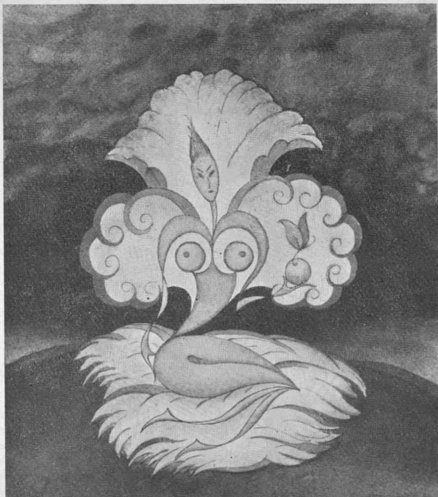
Sodobni ornamentalni motiv »Eva«. Iz nekdanjega motiva Eve, kot znak ženske lepote in zapeljivosti, je tu Eva podana analitično in simbolično samo kot žena vir človeškega rodu