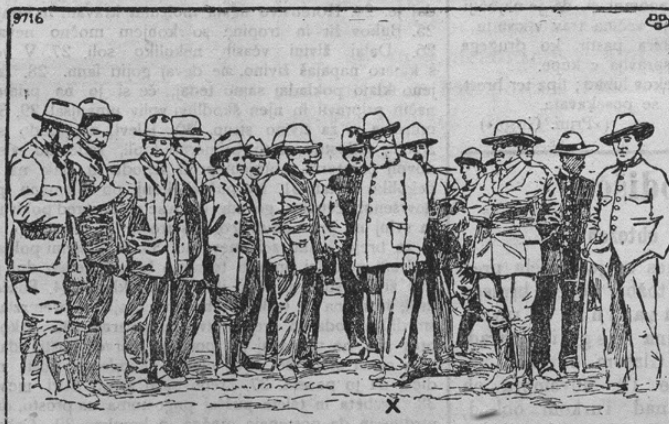
Der mexikanische General Carranza (X) mit seinem Stabe und europäischen Kriegsberichterstellern.

Poročali smo o vojni med Združenimi Državami Severne Amerike in Mehiko. Posebno vloga v tej vojni igra poveljnik vstašev general Carranza. Na eni strani igra patrijota in kriči, da bode svojo armado proti Amerikancem poslal; v tajnem pa se ponuja Amerikancem, češ da jim bode pomagal, ako ga priznajo za predsednika. Naša slika kaže generala Carranza z njegovimi oficirji in s poročevalci evropskih listov na bojišču.