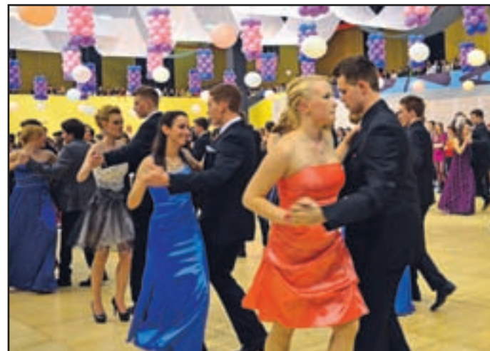
Utrinek s petkovega gimnazijskega večera ...

Ob tem želimo poudariti, da smo zagotovo koga tudi spregledali, saj je bila oba večera gneča precejšnja. In da so bili prav vsi lepi in zanimivi. Ne nazadnje je pomembno, da so se dobro počutili v izbranih slavnostnih oblačilih, ki so jih mnogi oblekli prvič.