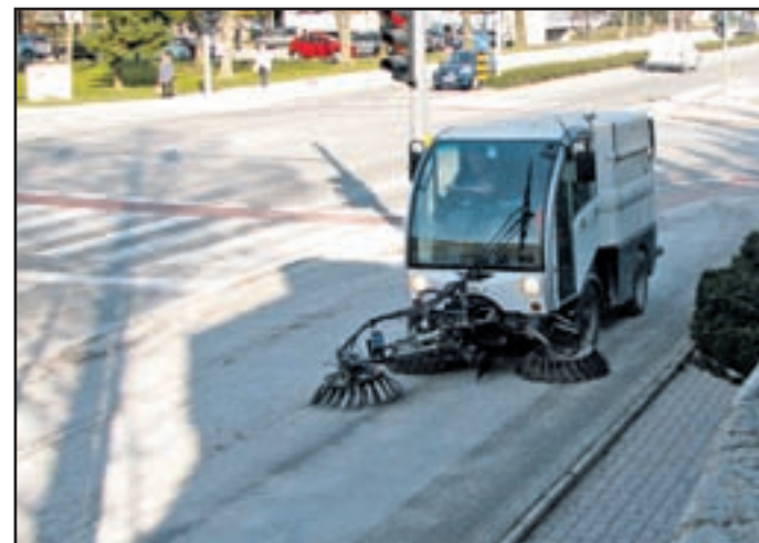
Ko se začne odstranjevanje peska, je zime menda nepreklicno konec.