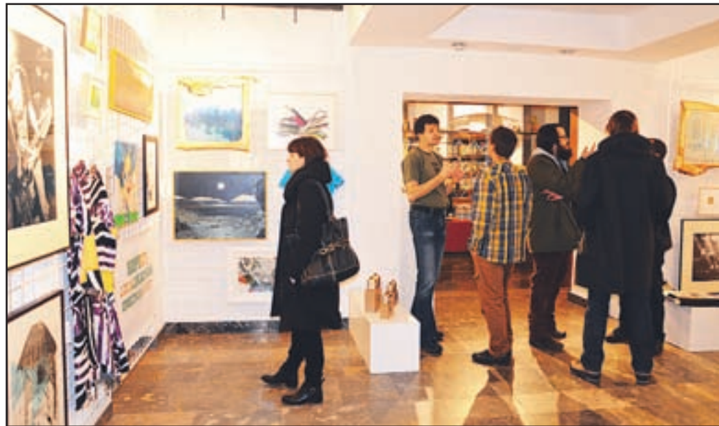
Razstava 'Kupi lokalnega umetnika' se bo poslovila le za mesec dni, potem bo v novi postavitvi spet zaživela v galeriji vile Bianca.

Velenje, 17. marca – Do torka, 25. marca, bo v galeriji vile Bianca še odprta razstava Kupi lokalnega umetnika. Gre za koncept skupne predstavitev slikarjev in oblikovalcev iz Šaleške doline, s katerimi imajo v Galeriji Velenje še velike načrte. Že čez mesec dni bodo razstavo ponovno postavili v istem prostoru,