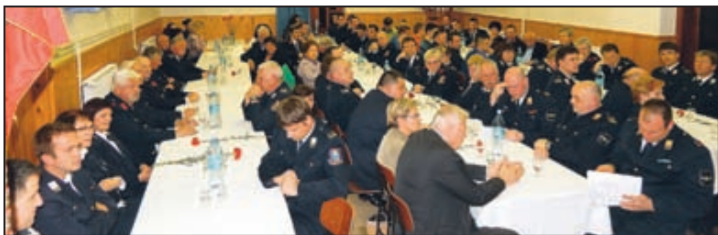
Z občnega zbora PGD Lokovica. Lani so bili izjemno uspešni na tekmovanjih.