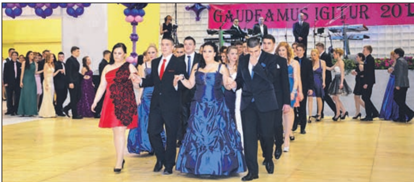
V soboto so zaplesali še dijaki zaključnih letnikov vseh ostalih šol ŠCV.

»Sprostimo spominom krila, v njih je naša skupna pot. Danes se bo sprostito veliko lepih spominov, spominov na srečne dni, morda na