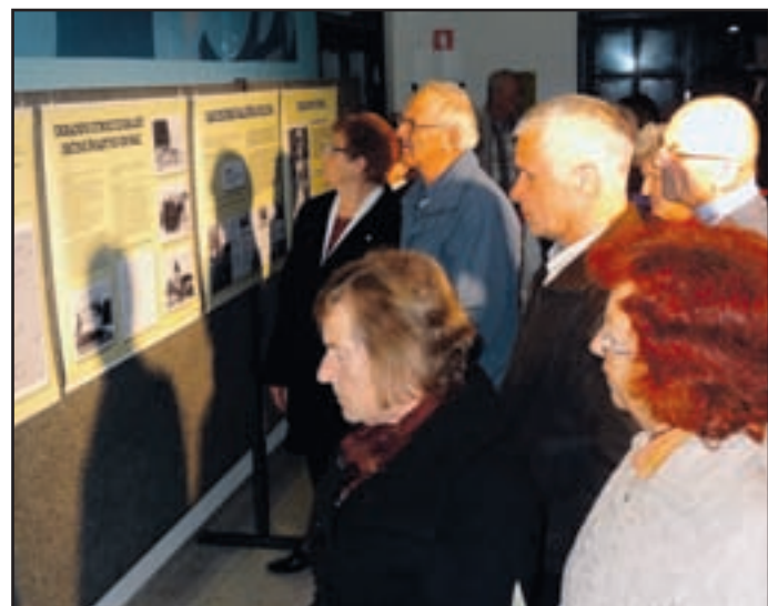
Utrinek z razstave, na kateri so pogledi na slike in pripovedi kljub oddaljenosti dogodkov marsikomu prikradli solzo v oči.