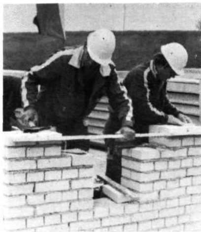
Delovno tekmovanje SGP Pionir

Poleg tega so komiteji za splošno ljudsko obrambo in družbeno samozaščito prejeli na skupnih sestankih ustna navodila ter pisna navodila za izvajanje vseh potrebnih ukrepov med vajo „Posavje 82“, ki so uporabna za načrtovanje za eventualno jedrsko nezgodo.