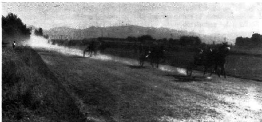
Arhivski posnetek kasaške dirke na nekdanjem hipodromu Matije Gabca v Krškem.

Smatramo, da je nujno potrebno ponovno preveriti sedanji obseg obveznosti in pravic posameznih občinskih zdravstvenih skupnosti do sredstev republiške solidarnosti ter ustreznost kriterijev in metodologije za spremljanje izvajanja zagotavljenega programa.