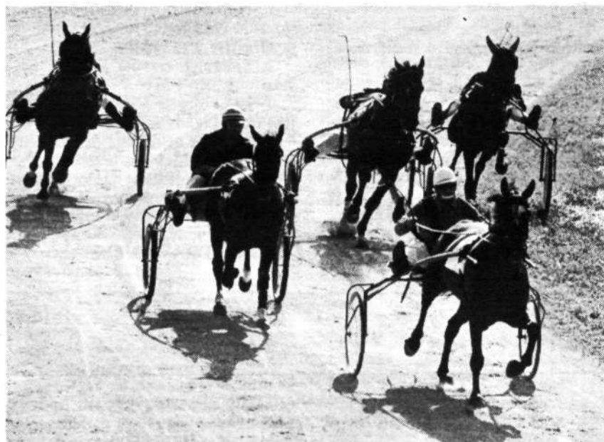
Hipodrom Bled, 1. 8. 1982 – od leve: Frida, Palmira (KK Posavje–Krško), Dino, Markiza II (KK Posavje Krško), Lars.