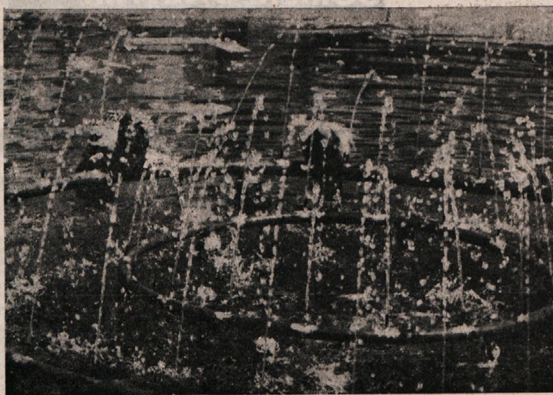
Vodomet pri cerkvi sv. Antona: igra vode in golobov.

Zato odgovorni krogi Otrag in «Ariane» tudi nemški uradni krogi poudarjajo nekatere značilnosti izstrelitvenega aparata Otrag, ki naj bi onemogočale vojaško uporabo. Predvsem gre za tekoče gorivo, ki zahteva vsaj 6 ur časa preden lahko pride do izstrelitve. Potem pa je sistem upravljanja, ki je zelo preprost. Za vojaške namene ta stroj ni primeren, ker se ne more vrnati na Zemljo. Vendar pa je gotovo, da