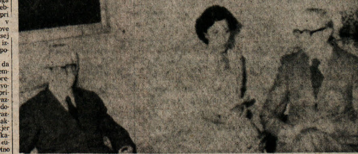
Belgijski znanji minister in predsednik izvršne komisije EGS je zaključil svoj obisk v Italiji, kjer se je s Furlanijem pogovarjal o prihodnjih evropskih parlamentarnih volitvah in drugih aktualnih problemih. Pred odhodom je Simoneta sprejel predsednik republike Leone.