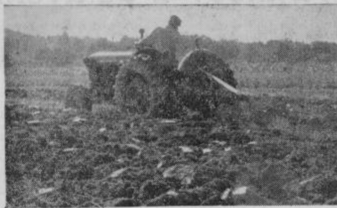
Oranje za strniščno setev je že v teku

Glasilo Socialistične zveze delovnih ljudi za območje bivšega ptujskega okraja Izdaja »Ptujski tednik«, zavod s samostojnim (finansiranjem) Direktor Ivan Kranjčič Odgovorni urednik: Anton Bauman. Uredništvo in uprava: Ptuj, Lackova 8. Telefon 156, čekovni račun pri Komunalni banki Maribor podružnici Ptuj, štev. 604-708-3-206. Rokopisov ne vračamo. Tiska Mariborska tiskarna Maribor. Celotna naročnina za tuzemstvo 750 din, za inozemstvo 1250 din.