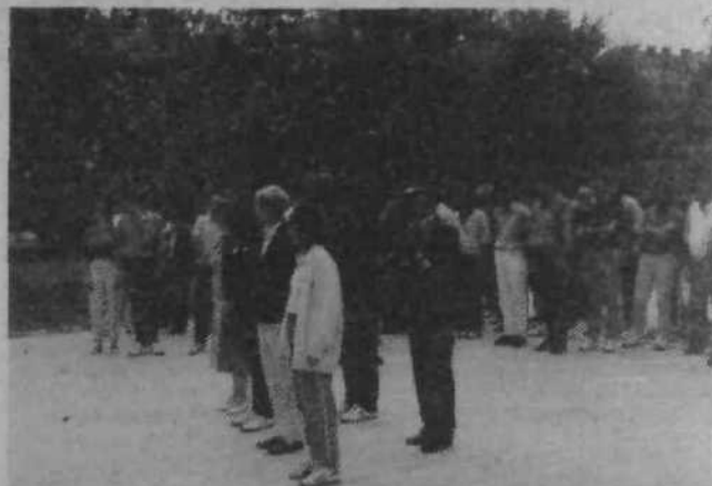
Delegacija obč. konference Zveze socialistične mladine Ljubljana Bežigrad med polaganjem venca na spomenik Goci Delčevu v Skopju.