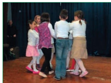
Otroci podružnične šole v Utiku so zapeli in zaplesali.