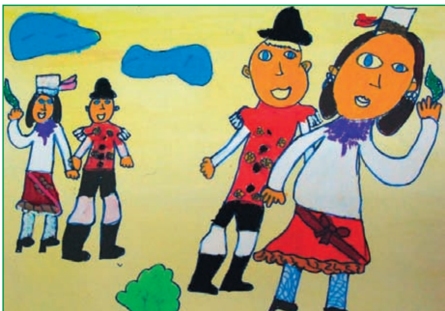
Lina Pipan, stara 6 let, je narisala tole sliko.