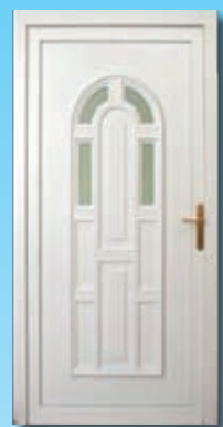
SLAVONIJA cena z montažo 942,92 €