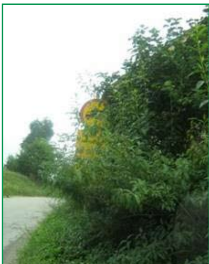
Ovirana preglednost ob občinski cesti zaradi preveč razraščenega rastiča tik ob cestišču.

Velik problem za varnost v cestnem prometu ter z vidika varstva cest predstavljajo tudi dotrajani in slabo vzdrževani objekti ob cestah. Ti ne samo kvarijo videz naselja pač pa prvenstveno predstavljajo potencialno nevarnost. Enako velja za lastnike objektov ob cestah, ki kljub jasno zapisani zahtevi v občinskem odloku o cestah, na strehe ne namestijo snegolovov in žlebov. Po opozorilu pa večina lastnikov zadevo uredi.