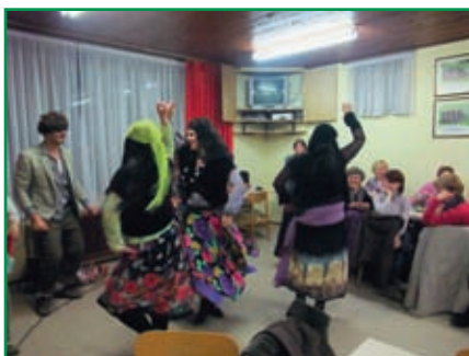
Tudi Vodice imajo svojevrstne domače cigane, ki pridejo v vsako družbo, kjer so zaželeni.