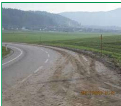
Preorana njiva tik do cestišča ter onesnaženo cestišče občinske ceste zaradi opravljanja kmetijskih del na površinah ob cesti.

cestišču tudi zmanjšajo vidljivost in preglednost na cesti.