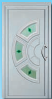
NIN cena z montažo 974,66 €

CENA ZA VHODNA VRATA JE Z MONTAŽO IN DDV 8,5% IN JE ZA FIZIČNE OSEBE. ZA VSE OSTALE JE POTREBNO OBRAČUNATI DDV 20%. VRATA SO SESTAVLJENA IZ ALU OKVIRJA IN PVC PANELA, TER BELE KLJUKE.