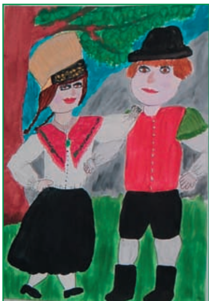
Likovno delo Andreje Merše.