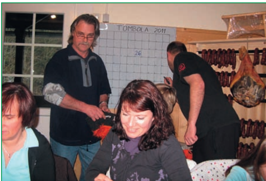
Občni zbor v hribih, kot se za planince spodobi.