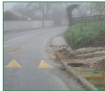
Onesnaženo cestišče občinske ceste zaradi izpiranja nepravilno urejene brežine.

Onesnaženja cestišč mnogokrat povzročajo tudi tovorna vozila, ki dovažajo in odvažajo potrebni material z gradbišč. Investitorji oziroma izvajalci gradbenih del, kljub visoki zagroženi kazni, le redko poskrbijo za čiščenja pnevmatik ob izvozu z gradbišča na cesto. Veliko število prevozov težko naloženih kamionov pa obenem pomeni tudi hudo obremenitev za vse lokalne ceste, ki, vsaj v večini primerov, niso bile predvidene za tako velike obremenitve. Dodatno delo pa tako vzdrževalcem cest kot javne infrastrukture povzroča tudi neurejeno odvo-dnjavanje s zasebnih parcel, ki na cestišča in v meteorne kanale odplavljajo zemljo in pesek ter jih mašijo.