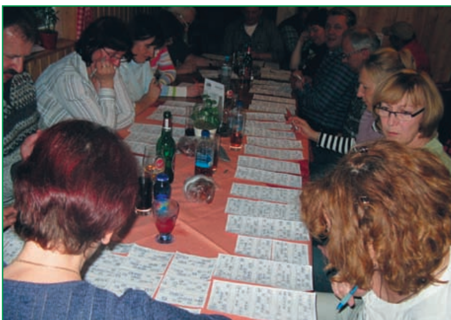
Vsakič pripravijo tudi tombolo.

Tako kot v preteklih letih, društvo tudi letos računa na sredstva iz občinskega proračuna. Predsednik je ob tej priložnosti dal besedo gospodu županu, ki je vse zbrane prav lepo pozdravil. Dejal je, da se že iz številne udeležbe na občnem zboru vidi, da društvo dobro dela in ima zveste člane. S svojo dejavnostjo skrbimo za zdrav način življenja, pa tudi za druženje, povezanost med seboj in optimizem, ki ga v teh časih še kako potrebujemo. Župan nas je povabil, naj se tako kot vsa leta do sedaj, tudi letos udeležimo čistilne akcije.