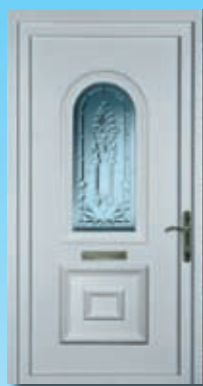
DUKAT cena z montažo 986,59 €