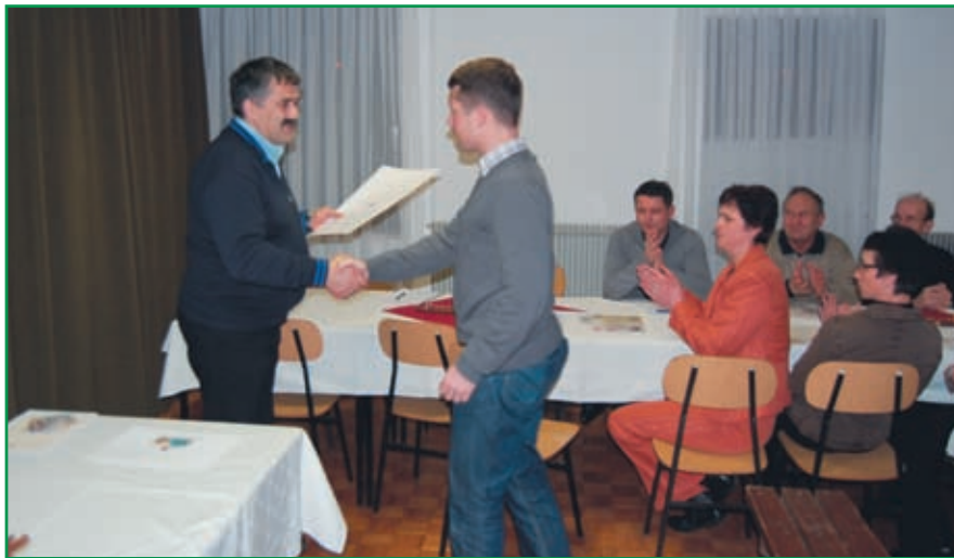
Poveljnik prejema priznanje GZ Slovenije društvu za pomoč občanom ob septembrskih poplavah.

Kot je že v navadi, če ne poseže vmes kakšna višja sila, je bila tudi tokratna zadnja sobota v januarju (29. 1. 2011) rezervirana za občni zbor članov Prostovoljnega gasilskega društva Šinkov Turn. V dokaj hladnem večeru so se v gasilskem domu v Kosezah zbrali člani in povabljeni gostje, ki so po uradnem delu še dolgo nadaljevali klepet v prijetnem in toplém vzdušju.