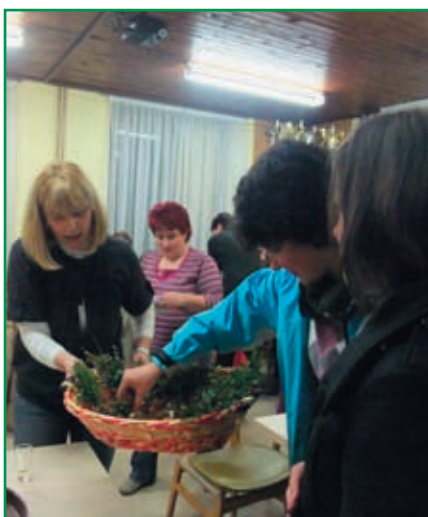
Ženske so ob prihodu dobile šopek naravnih okoliških rožic.