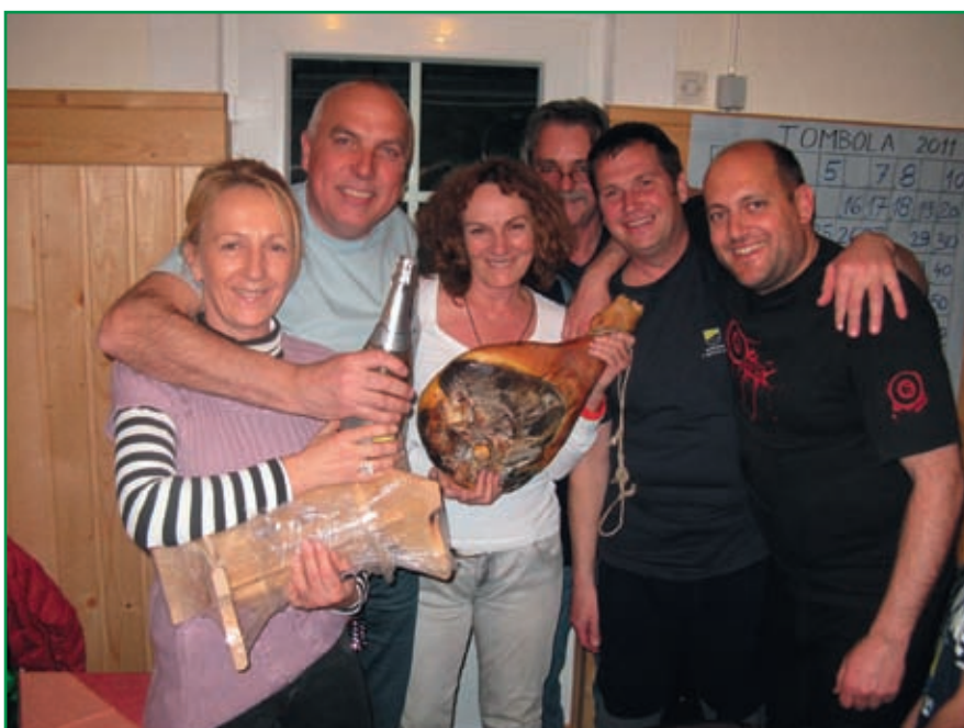
Društvo je vesela družina, ki rada hodi tudi v hribe.