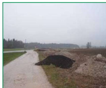
Nepravilno odložen material in ob cestišče kot ovira v cestnem prometu.

Poleg onesnaženja cest velja omeniti tudi znatno povečanje nedovoljenih prekopov na cesti in izvajanja različnih posegov v varovalnih pasovih občinskih cest brez soglasja upravljavca. Nedovoljene ali neskladne gradnje ter odlaganje različnega materiala v tem pasu lahko posledično povzroča oviro v cestnem prometu. V okviru nadzora teh aktivnosti smo zato kontrolirali tako ustreznost pridobljenih upravnih dovoljenj in soglasij za izvajanje posegov, npr. če si je investitor dovoljenje sploh pridobil. Preverjali smo tudi ustreznost zavarovanja del na ali ob cesti, saj je ustrezna prometna signalizacija in ureditev lahko življenjskega pomena.