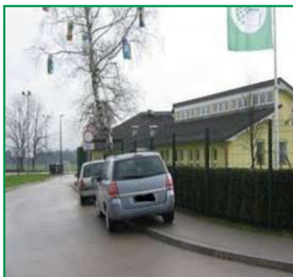
Primeri nepravilno parkiranih vozil ob šoli in vrtcu.

Vsako leto naši redarji sodelujejo tudi v preventivni akciji ob prvih šolskih dneh v mesecu septembru. Prisotni so bili na območju osnovne šole ter na vseh lokacijah šolskih poti. V teh dneh naši redarji občane predvsem opozarjajo na pomembnost varovanja najšibkejših udeležencev v cestnem prometu.