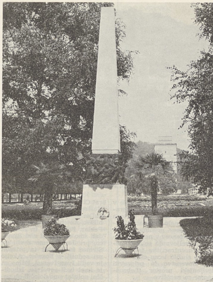
Spomenik padlim za svobodo in žrtvam fašizma v zdraviliškem parku