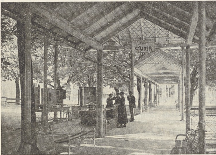
Nekdanja pivnica za vrelce styria (fotografija je iz leta 1935)

zdravilišču samem kakor tudi v širšem območju krajevne skupnosti.