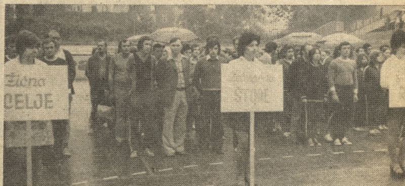
V Mariboru so bile dne 22. junija metalurške igre, ki se jih je udeležila tudi 45-članska ekipa naše železarne