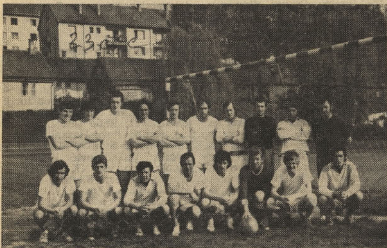
Ekipe nogometašev Železarne Štore je v močni konkurenci zasedla 3. mesto

Nastopilo je 30 ekip, med katerimi je naša izbrana ekipa dosegla solidno 3. mesto.