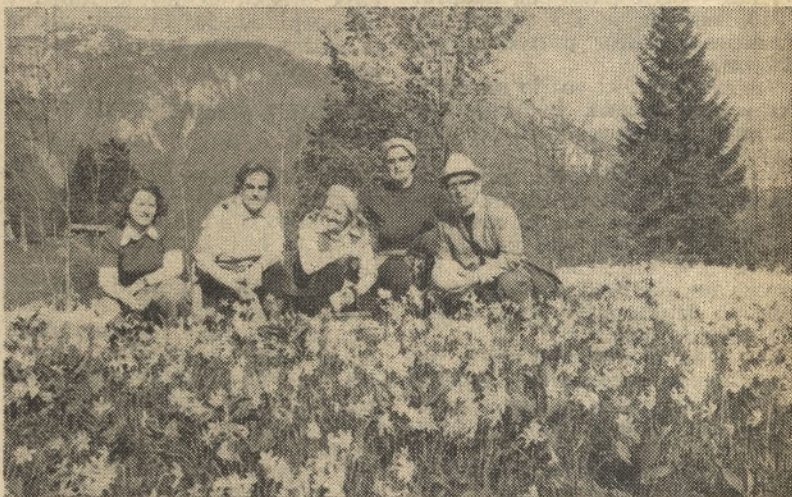
Zavidanja vreden užitek sredi cvetne preproge narcis

V tem prelepem planinskem kotu se prva pomlad šele najavlja. Tu so še debele naslage