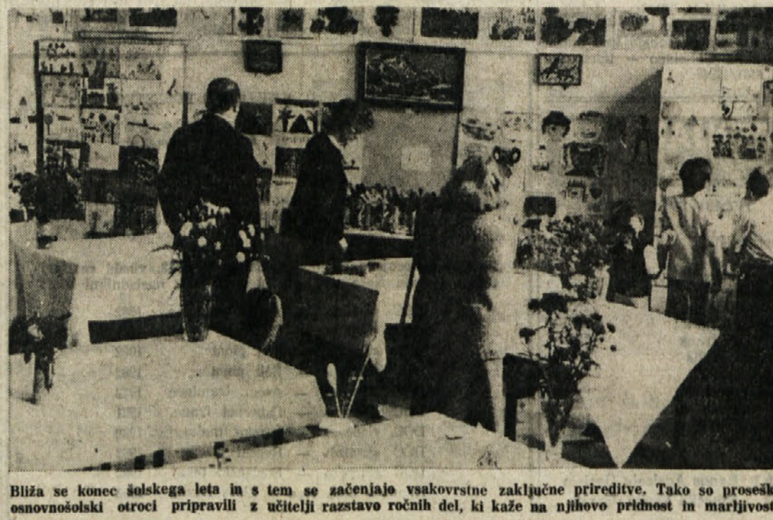
Blizu se konča šolsko leto in s tem se začnejo vsakovrstne zaključne prireditve. Tako so posejli osnovnošolski otroci pripravili z učitelji razstavo ročnih del, ki kaže na njihovo pridnost in marljivost.