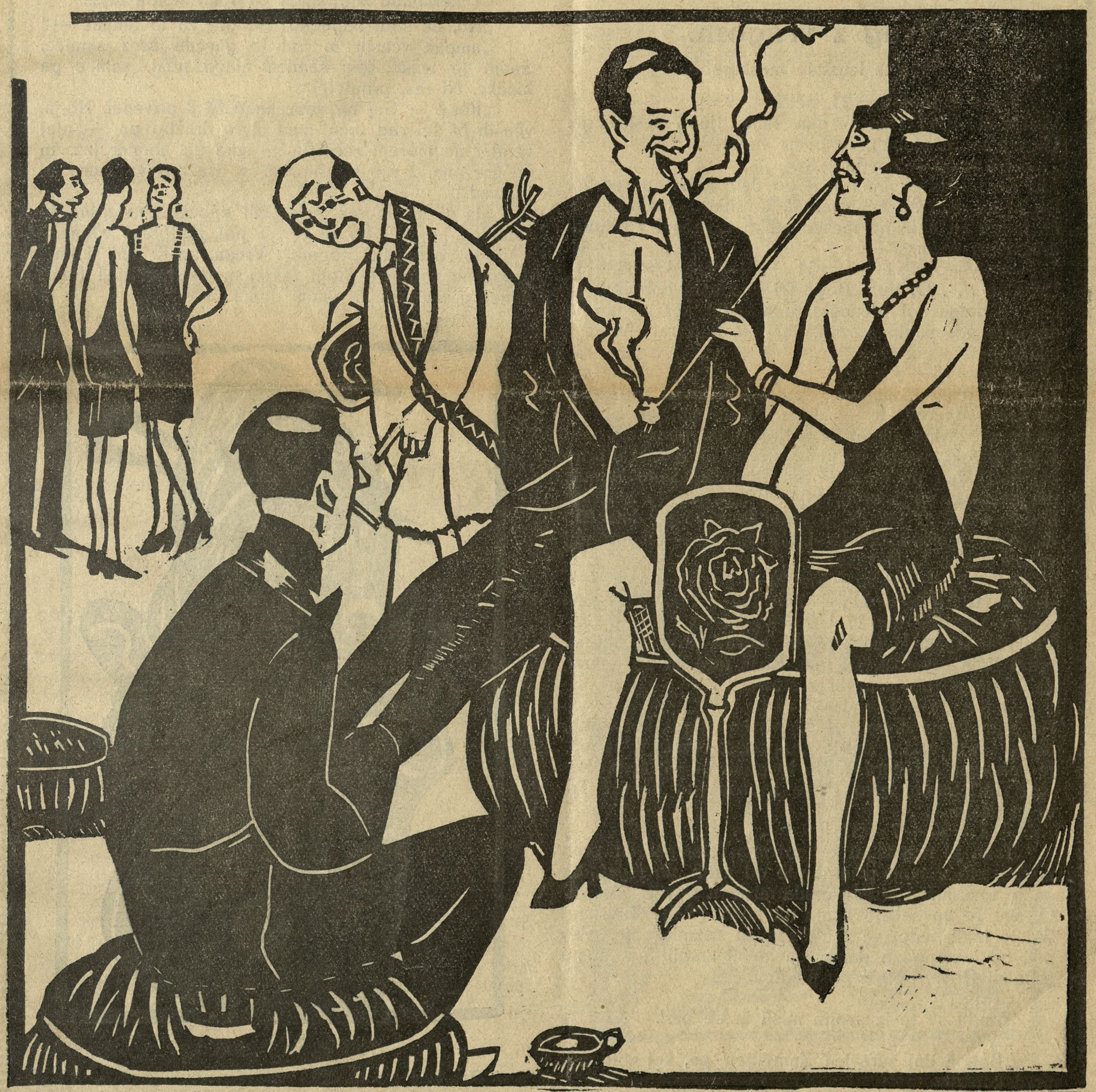
Moderni javni lokal.