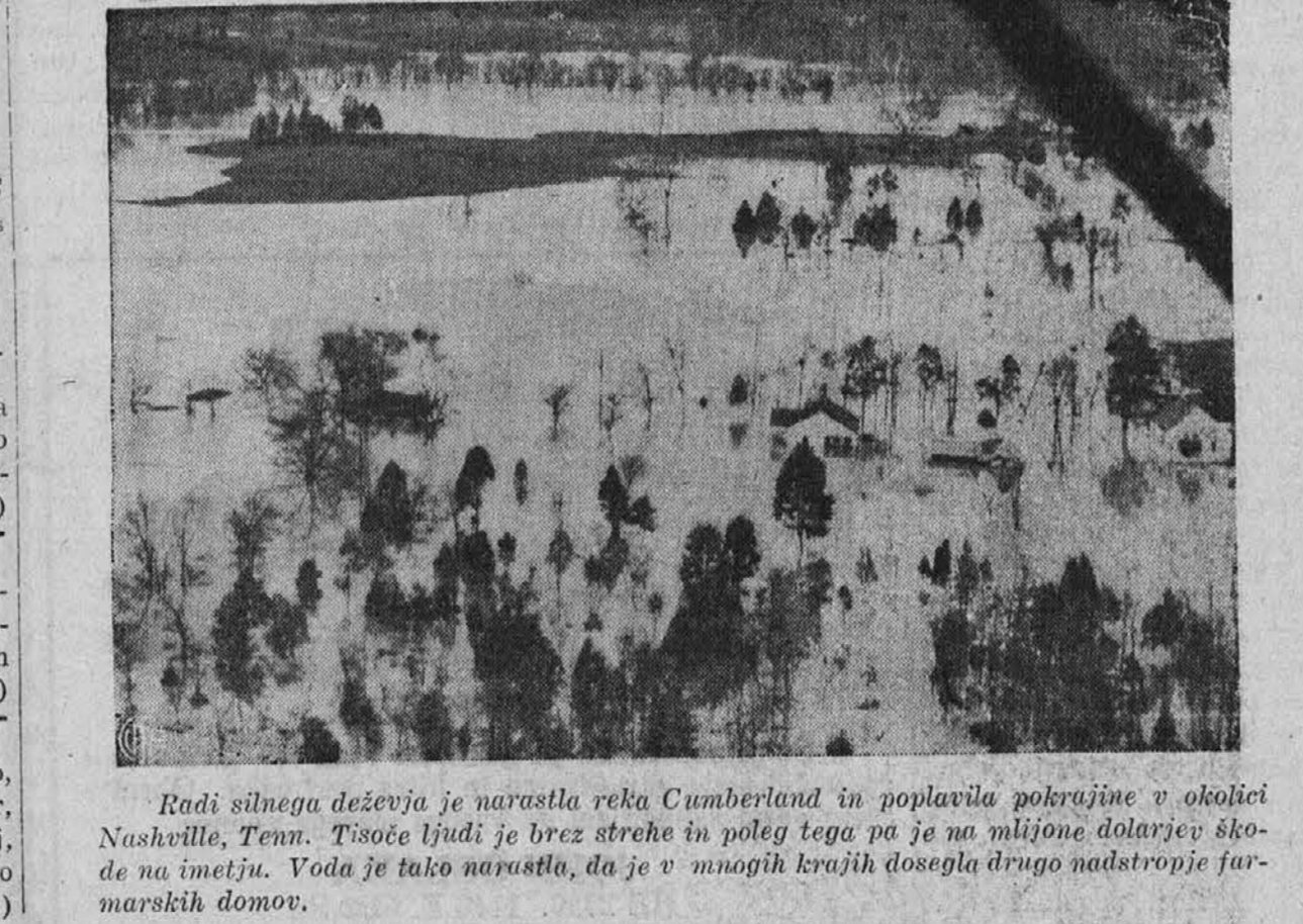
Radi silnega deževja je narastla reka Cumberland in poplavila pokrajine v okolici Nashville, Tenn. Tisoče ljudi je brez strehe in poleg tega pa je na milijone dolarjev ško- de na imetju. Voda je tako narastla, da je v mnogih krajih dosegla drugo nadstropje far- narskih domov.