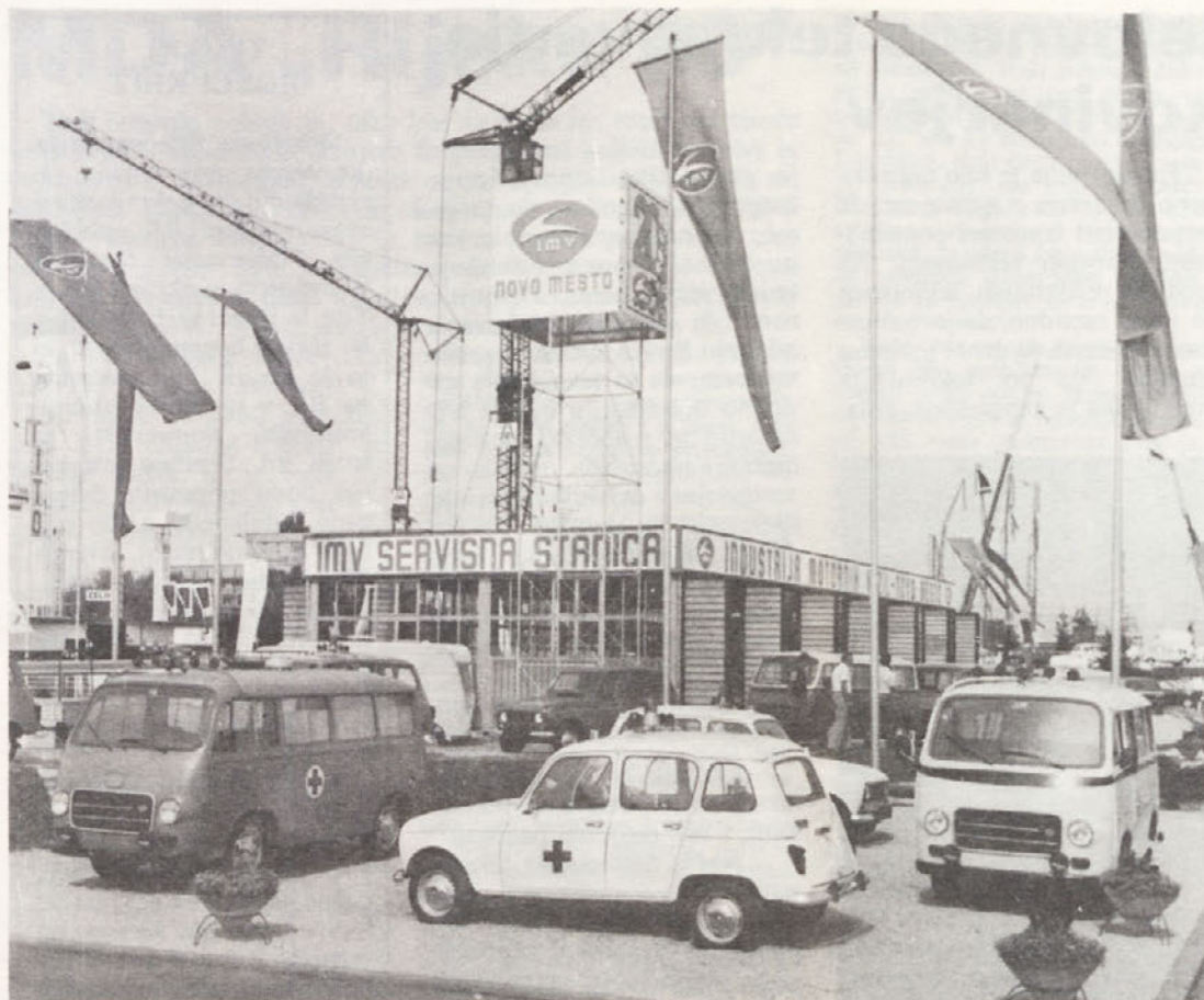
Izdelki naših rok, pameti in pridnosti, postavljeni na ogled, oceno in nakup na letošnjem jesenskem velesejmu v Zagrebu. Lahko smo ponosni na številna priznanja, ki so jih naši delavci poželi tudi tokrat pred očmi celotne jugoslovanske javnosti in tujine.