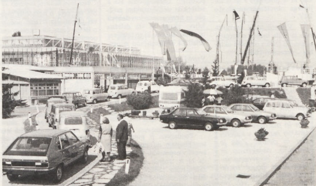
Nova podoba naših razstavljenih izdelkov avtomobilske industrije na le tošnjem zagrebškem jesenskem velesejmu. Proizvodi iz naše avtomobilske in prikoličarske proizvodnje so bili tudi topot v ospredju največjega zanimanja številnih obiskovalcev sejma.

IMV KURIR izdaja delovna organizacija Industrija motornih vozil Novo mesto – Izhaja vsakih 14 dni v 6750 izvodih – Ureja uredniški odbor, glavni in odgovorni urednik Simo Gogič – Uredništvo in uprava: Novo mesto, Zagrebška cesta 18/20 – Grafična priprava: DITC Novo mesto, TOZD Dolenjski list, tisk TOZD Tiskarna Novo mesto.