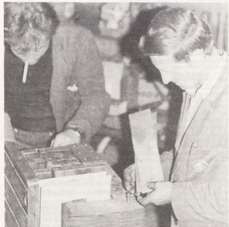
Sestavljanje transformatorjev ne sodi v resor tekočega vzdrževanja. Vendar se naši vzdrževalci—električarji lotijo tudi takih del z zavestjo, da tako pripomorejo k čim manjšemu zastoju v proizvodnji avtomobilov.

organizacija. Kakor ta v prvih dneh delovanja sodišča ni našla svojega mesta in se ni kaj prida vključevala v postopek TOZD ali pred sodiščem, pa je treba zdaj ugotoviti, da se je stanje močno spremenilo. Sindikat se namreč vse bolj uveljavlja in opravlja svoje ustavno in zakonito funkcijo. Ob še uspešnejšem delu pa bo vsekakor prišlo tudi do tega, da bodo sporna razmerja razrešena že tam, kjer so nastala, t. j. med delavci samimi. Takrat pa se bo seveda zmanjšalo število novih zadev, ki zdaj, žal, še naraščajo.