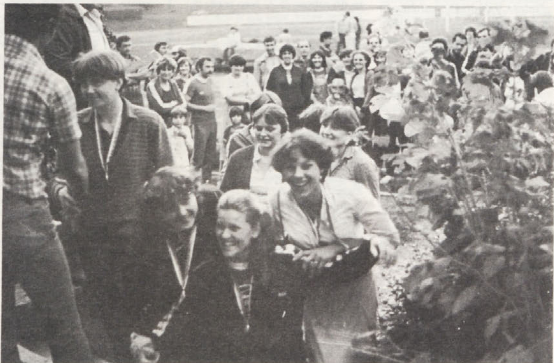
Pri podeljevanju kolajn v teku 4-krat 60 metrov nasmeh ni spremljal le tekmovalk, marveč celotne ekipe IMV.