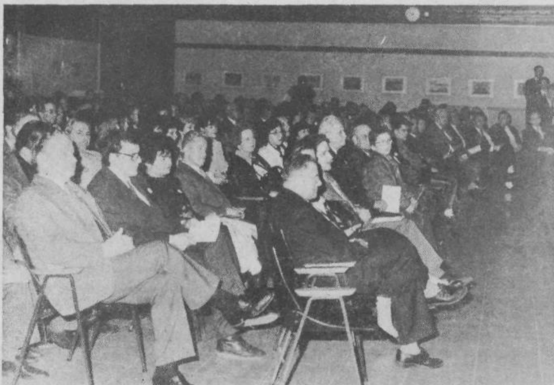
Osrednje proslave se je udeležilo veliko obiskovalcev

Družbeni pravobranilec je lahko v veliko pomoč tudi pri pripravi posameznih aktov, zato na to še posebej opozarjamo delovne organizacije in skupnosti.