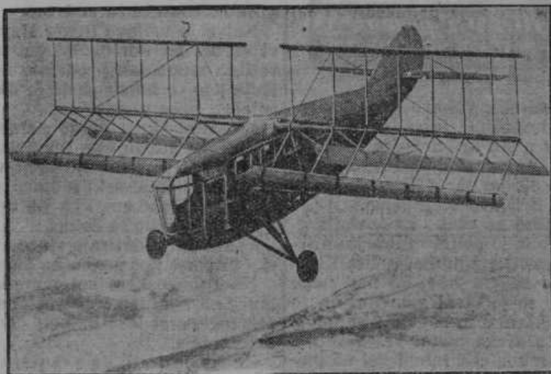
V Berlinu so izdelali letalo, s katerim se je mogoče dvigniti navpično v zrak in istotak je mogoč tudi pristanek.