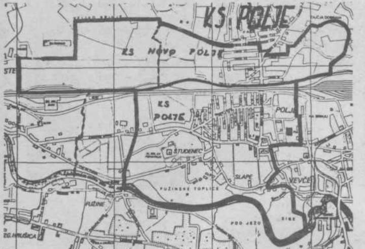
KS Polje in KS Novo Polje