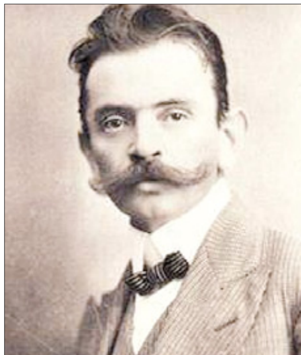
Ivan Cankar (1876-1918) sodi v sam vrh slovenske književnosti

Danes bodo Ivana Cankarja počastili na več spominskih dogodkih in prireditvah v Ljubljani