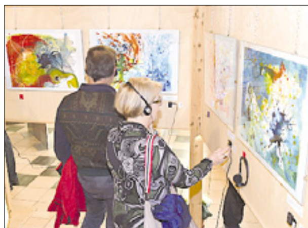
Izdelki domačih likovnikov v KD Vodnik