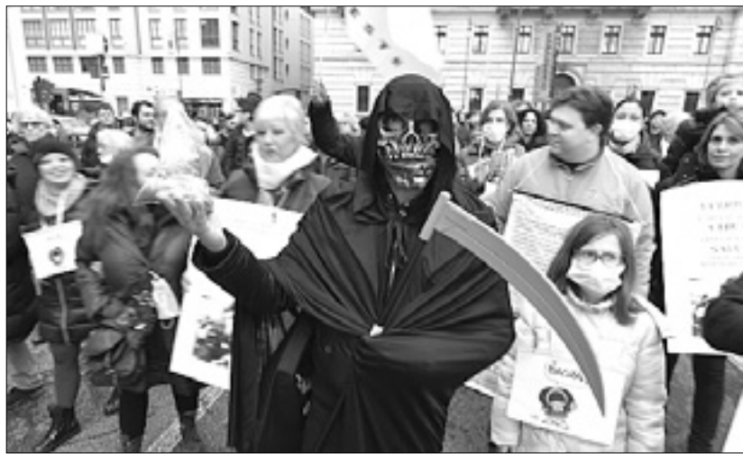
Odbor 5. december je januarja letos že priredil množičen protest

Vendar, opozarjajo pri Odboru 5. december, vprašanje škedenjske železarne ni več krajevna, ampak mnogo večja zadeva, ki presega lokalno stvarnost, saj je ohranitev delujočega plavža in koksarne v interesu same italijanske vlade. Protestniki namreč trdijo, da so prebivalci Škedenja le poskusni zajci v okviru širšega načrta, katerega cilj je obnovitev delovanja veliko večje »pošasti«, kot je škedenjski obrat, točneje velikega železarskega kompleksa družbe Ilva v Tarantu. Vlada Mattea Renzija namreč želi ohraniti Ilvo v italijanskih rokah, zato podpira oblikovanje »velenaveze« veli-