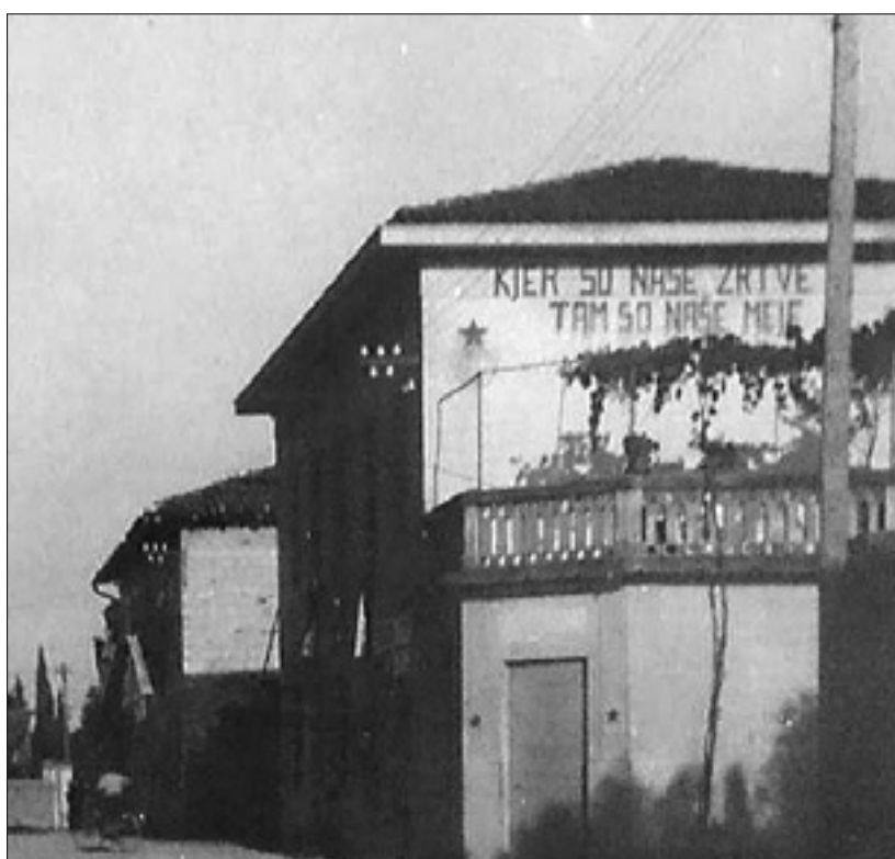
Nekdanji napisi na domu Budal (levo) in na steni štandreške hiše (zgoraj)