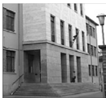
Zavod Cossar-Da Vinci BUMBACA

Neznanci so vlomili v stavbo višješolskega zavoda Cossar-Da Vinci v Drevoredu Virgilio v Gorici ter poškodovali avtomate s hrano in pijačo, ki jih uporabljajo dijaki in šolsko osebje. Iz njih so ukradli vso gotovino. »Škodo še ocenjujemo,« so povedali na poveljstvu karabinjerjev. Tatvina se je zgodila med soboto in včerajšnjim dnem, ko je poškodovane avtomate opazilo pomožno osebje. Avtomati zavoda Cossar-Da Vinci so bili tarča tatov tudi leta 2014: štiri mladi Goričani, stari med 15 in 17 let, so iz njih tedaj ukradli okrog 250 evrov.