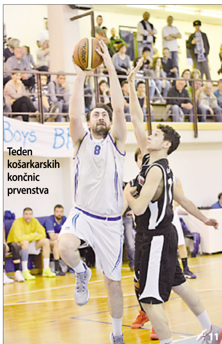
Teden košarkarskih končnic prvenstva