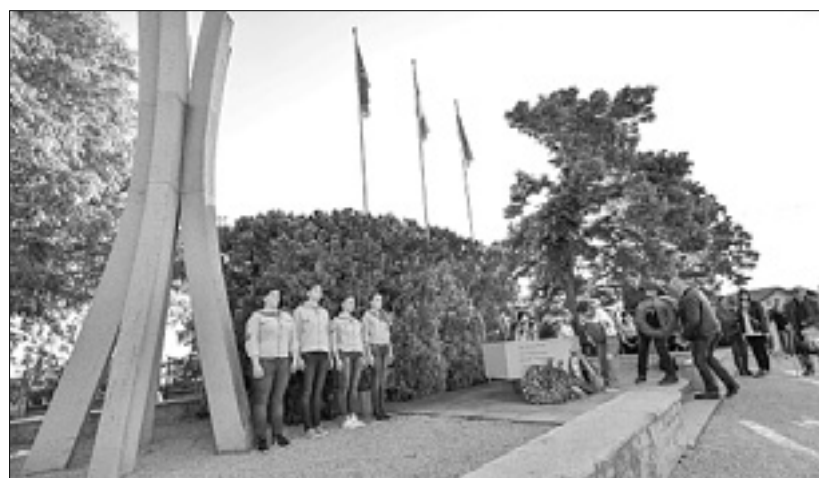
Na častni straži so stali tabornice in taborniki RMV