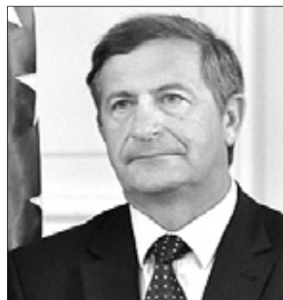
Slovenski zunanji minister Karl Erjavec

»Dežela FJK je v letih 2006 in 2007 brez prehodnega posvetovanja s prizadetimi slovenskim prebivalstvom in njegovimi organizacijami in krajevnimi občinami, samovoljno vključila 12.630 ha kmetijskih in gozdnih površin, na skupnih 17.000 ha Tržaške pokrajine in Krasa, v zavarovano območje Natura 2000, kar predstavlja 75 odst. vseh kmetijsko gozdnatih površin na omenjenem območju, ki je obenem tudi območje, na katerem smo Slovenci zgodovinsko naseljeni.« To dejstvo je po oceni KZ povzročilo Slovincem na tržaškem in goriškem Krasu, poleg splošne narodne škode tudi veliko gmotno škodo, ker se je vrednost zemljišč na zavarovanih območjih zelo znižala. Računamo, da gmotna škoda presega 200 milijonov evrov.