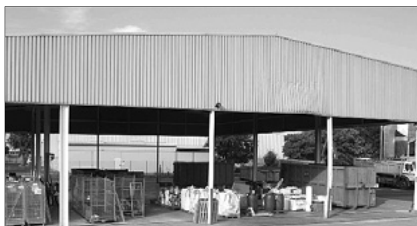
Zbirni center v Gregorčičevi ulici

41-letni državljani Sierre Leone je odnesel pet kompresorjev, sedem televizorjev, tri zvočnike in en mešalnik