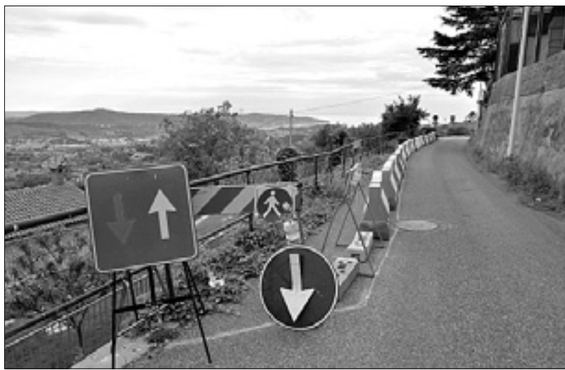
Cesta je bila včeraj še prevozna, čeprav je vozni pas zožen