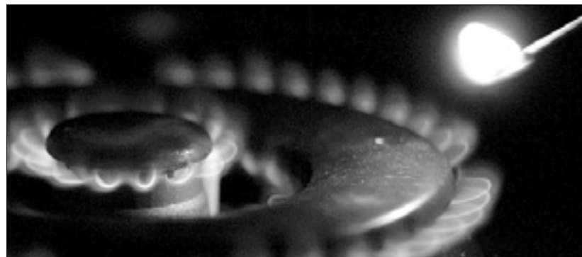
Donatella Gironcoli (levo), članica odbora proti povišanju računov za plin