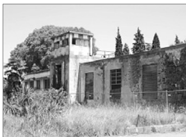
Nekdanji nadzorni stolp na goriškem letališču

Do 5. maja, ko se je iztekel rok za prijavo, pripravljenosti za odkup ni izrazil nihče - Pokrajina še ni sklenila, kako naprej