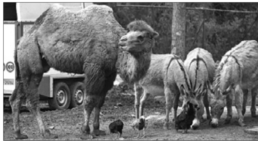
Velblod Paolino na trebenski farmi

Pri Globojnerju med iskanjem naleteli na razpadajoči trupli krave in telička