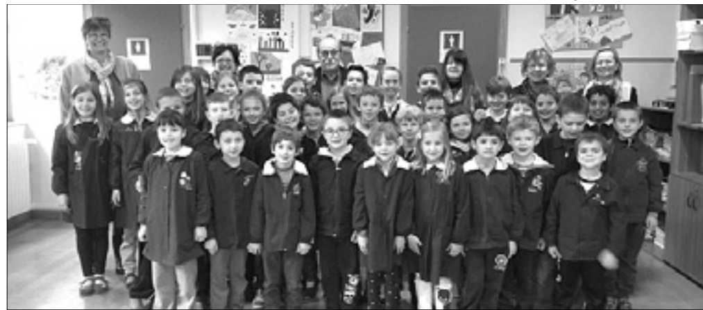
Skupinska slika z uglednim gostom

Konec aprila je v osnovno šolo Alberta Sirka v Križu prišel na obisk pesnik Miroslav Košuta. Povabili smo ga, ker je Križan, ker je pred kratkim slavil okroglo obletnico rojstva in ker vsi zelo radi prebiramo njegove pesmi. Predstavili smo mu kratek kulturni program. Zapeli smo in recitali njegove pesmi, ki govorijo o morju, jadrnih, krasu, živalicah. Nato nam je gospod Košuta pripovedoval o svojih