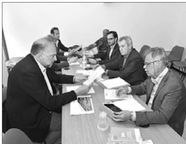
Predstavniki Kmečke zveze so Cosoliniju iznesli svoje zahteve in predloge