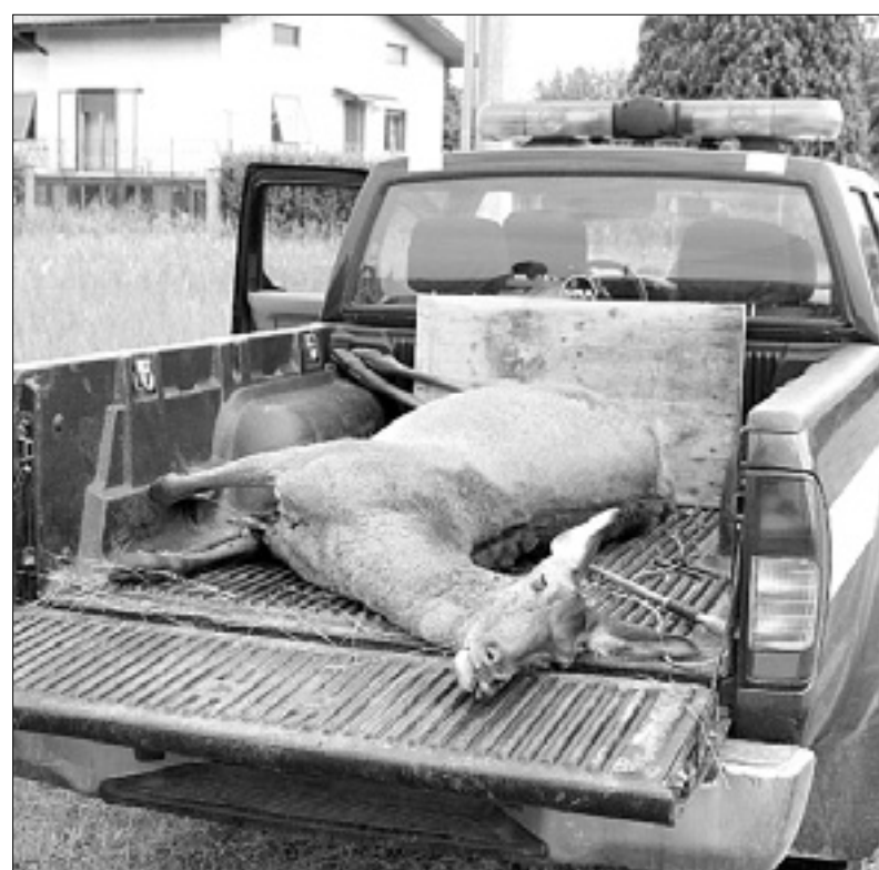
Poginula žival včeraj na vozilu pokrajinske policije

»Šlo je za mlado, a odraslo žival,« je za Primorski dnevnik včeraj povedal Michele Benfatto iz pokrajinskega urada za divjad, lov in naravne resurse. Po njegovih besedah je bila košuta po vsej verjetnosti noseča, saj se jelenovi mladiči običajno skotijo