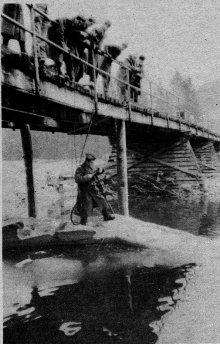
Vojaki popravljajo grušoveljski most