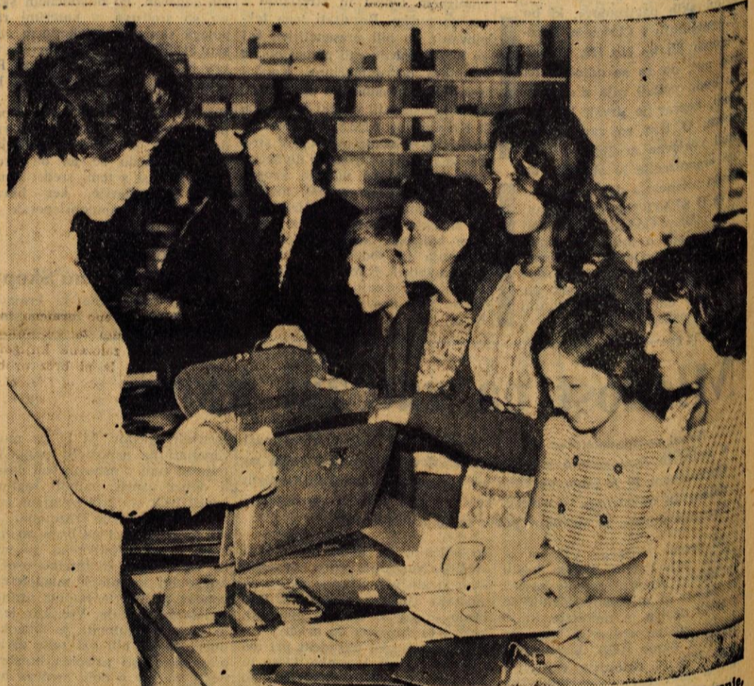
Jeseniška knjigarna je zlasti s šolskimi potrebščini, po katerih je te dni veliko povpraševanje, dobro založena

BLED — V tem tednu je bilo na Bledu v Kazini več prireditev, med njimi družabna revija Mala olimpiada, ki je bila na sporedu minuli torek. V sredo so spet gostovali v Kazini člani folklorne zboru Svobode Jesenice s sporedom jugoslovanskih narodnih plesov. Največ zanimanja pa je vzbudila glasbena prireditev znanega zagrebškega kvarteta »4M«.