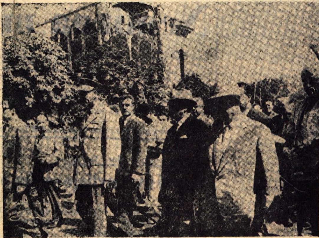
Premier Hruščov si je v spremstvu predsednika Tita v četrtek dopoldne ogledal dela v porušenem Skopju