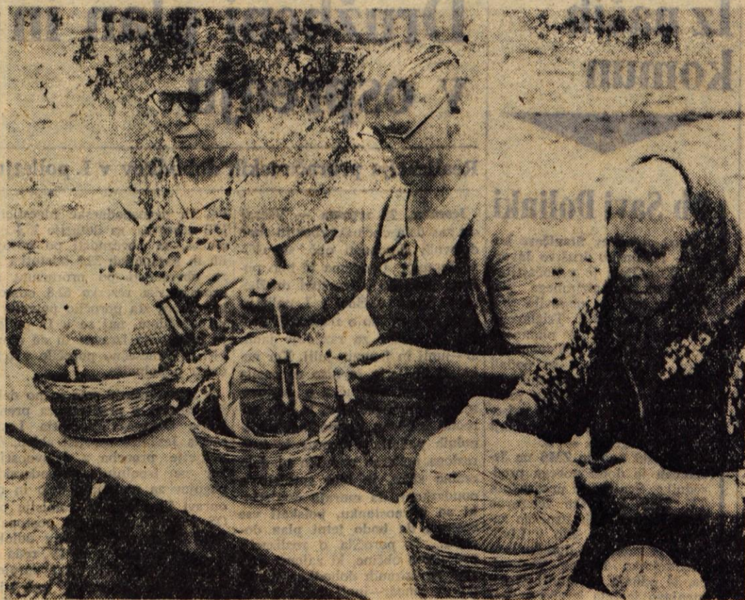
Turistično društvo Železniki bo priredilo jutri zanimivo prireditev — I. čipkarski dan, ki bo, kot napovedujejo, postal tradicionalna prireditev. Med pestrim programom bo vsekakor najzanimivejše tekmovanje čipkarjev

● O STATUTIH KS — Člani KO SZDL v Godešiču so ondan razpravljali o predlogu osnutka statuta krajevnih skupnosti in številu le-teh. O tej razpravi in njihovem mnenju bomo poročali v eni izmed naslednjih števil našega lista.