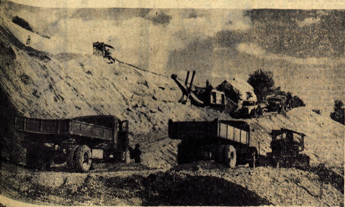
Dela na avto cesti so marsikje praktično že v teku, zlasti tam, kjer ozka prometna grla ne dopuščajo odlašanj. — Na sliki: obsežna dela v Bistrici pri Naklem

Organizatorji, mladina predvojaške vzgoje, člani kulturne skupine jeseniško-bohinjskega odreda pa tudi ostali prebivalci Jesenic se pripravljajo na velik pohod in zgodovinsko praznovanje v Cerknem, katerega praznovanje so pričeli na Jesenicah že v soboto, z otvoritvijo dokumentarne razstave »Leta 1943« in ki bo dopolnjeno tudi z raznimi propagandnimi, kulturnimi in drugimi akcijami na večer pred proslavo. — P. U.