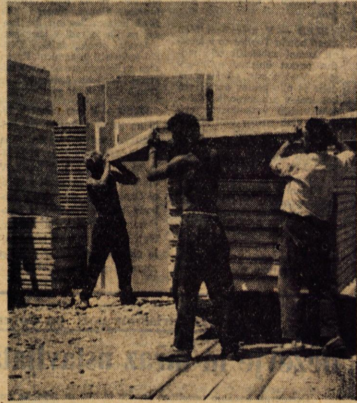
Delavci težaki imajo v teh dneh precej dela pri nakladanju materialnih hiš za »satelitsko« naselje v Skopju

● Z razvojem ostale industrije, predvsem kovinske in elektrotehnične ter z istočasnim izobraževanjem kadrov za ti industrijski panogi, ni več problem strugarjev, rezkarjev ipd., temveč je problem dobiti dovolj močnega, fizično sposobnega delavca. To pa narekuje, da se morajo njihovi osebni dohodki bistveno popraviti, ne le zaradi pomanjkanja te delovne sile, pač pa predvsem zaradi dejanske večjega vlaganja živega dela v proces proizvodnje. Obaj elementa pravilnika o delitvi OD ne pomenita neko urejanje posameznih primerov, pač pa pomenita stvar in pravičen odnos do ljudi, ki delajo v proizvodnji. — St. Skrbar