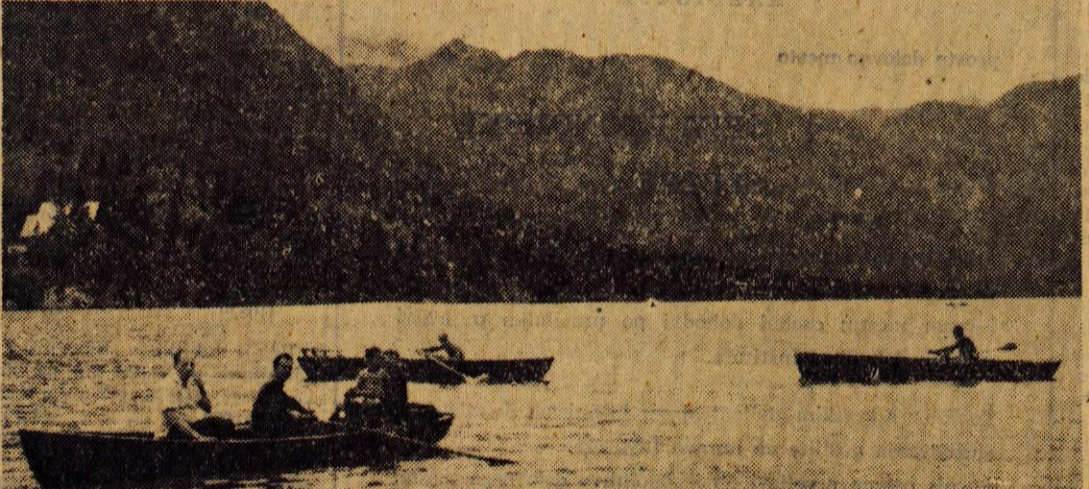
Kadar se nad Bohinjskim jezerom zadržujejo oblaki, številni turisti v čolnih zlahka pozabijo na sončenje

In od kod so bohinjski gostje? Največ je Zahodnih Nemcev, ki jim sledi Avstriji in Skandinavci, medtem ko prihajajo sem tudi bolj oddaljeni — na primer iz Urugvaja in Čilea. Predvsem v hotelih prevladujejo tujci, saj je bilo na primer samo v največjem hotelu Zlatorog v ponedeljek 171 tujcev in 14 domačih turistov. — J. Zontar