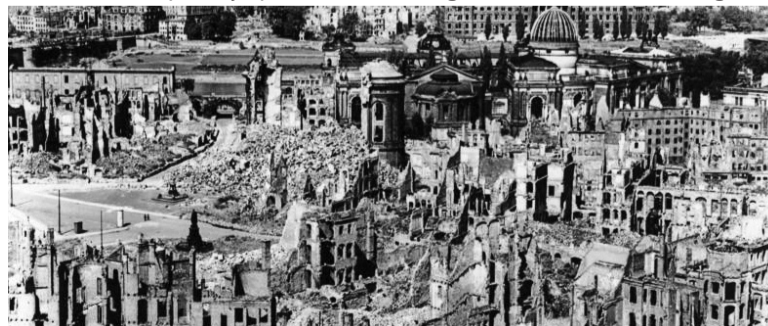
Dresden po bombardiranju

13. februarja 1945 se je začelo dvodnevno britansko-ameriško bombardiranje Dresdna. V spornem in vojaško vprašljivem letalskem napadu je po različ-