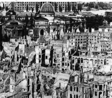
Dresden po bombardiranju

19. februarja 1944 se je v Črnomlju začelo zasedanje Slovenskega narodnoosvobodilnega