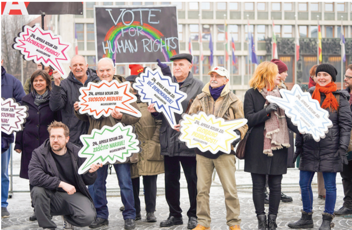
Civilna iniciativa Glas ljudstva

Pred nami je super volilno leto, ki ga bomo začeli s parlamentarnimi volitvami 24. aprila. V iniciativi Glas ljudstva, ki združuje že več kot sto organizacij in mnogo posameznikov civilne družbe, smo zato s skupnimi močmi in strokovno podkrepitvijo sestavili seznam 138 zahtev za politične stranke. Pred volitvami zahtevamo, da se stranke do naših predlogov opredelijo, volivcem pa bomo ponudili možnost, da s preprosto spletno aplikacijo ugotovijo, katera stranka je najbližje njihovim lastnim političnim stališčem. V iniciativi Glas ljudstva bomo do volitev izvajali še različne dejavnosti, ki bodo v ospredje dajale vsebino in mobilizirale ljudi na volitve.