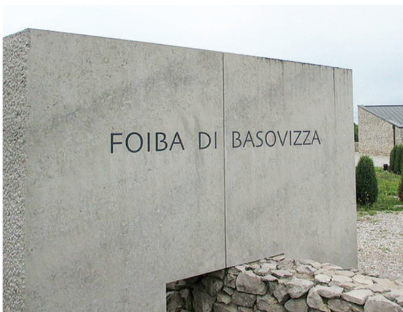
Spomenik pri bazoviški fojbi

delovanje z drugimi odporiški silami ovirale predvsem nasprotujoče si mejne zahteve. Ob koncu vojne je tako vsaka stran pričakovala svojega osvoboditelja, angloameriške sile ali jugoslovansko armado, in v drugem prepoznavala novega okupatorja.