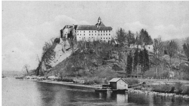
Grad Borl v letih 1941–1945

Upor na Štajerskem se je začel kaj kmalu po okupaciji. Pripravljenost na upor proti nacističnemu okupatorju je bila velika, vprašanje je bilo le, kako bo ta upor organiziran in kdo bo prevzel pobudo zanj. Nanj so se organizirano začeli pripravljati tako komunisti kakor krščanski socialisti, sodelovali pa so tudi drugi. Po ustanovitvenem sestanku se je mreža krajevnih in terenskih odborov OF začela naglo