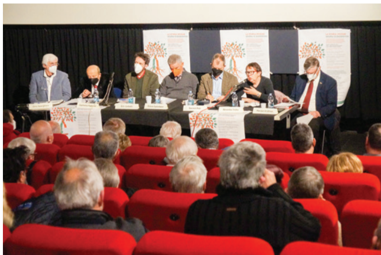
Posvet v Gorici je bil dobro obiskan in je bil odgovor na 10. februar, ko v Italiji ob dnevu spomina vsako leto zapiha veter revanšizma in nacionalizma.

nje zgodovinske krivde fašizma nujno potrebno. Dan spomina je vsako leto priložnost za bruhanje nacionalističnega strupa. Filmi s parafastično vsebino, kakršni je Rosso Istria, izkrivljajo preteklost. Poudarja se vloga žrtve zaradi fojb in eksodusa, v šolskih učbenikih pa Gobetti še ni zasledil omembe italijanske okupacije Slovenije leta 1941. Di-