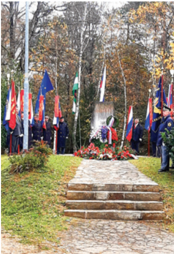
Lokve pri Črnomlju

Na Lokvah pri Črnomlju pa smo se zbrali 7. novembra in počastili 77. obletnico tragične nesreče pri preizkušnji novega orožja, ko je umrl partizanski komandant Franc Rozman - Stane.