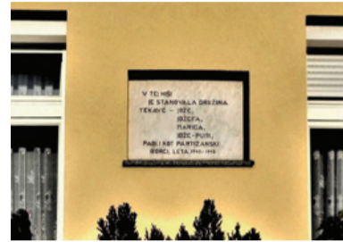
Spominska plošča na Tekavčevi hiši

lje in le pogumnim posameznikom se danes lahko zahvalimo, da smo se uspeli upreti osvajalcem in njihovim pomagačem. Območje Šaleške doline je vedno spadalo med uporniške kraje. Nasilje, ki ga je izvajal okupator s svojimi ovadun-