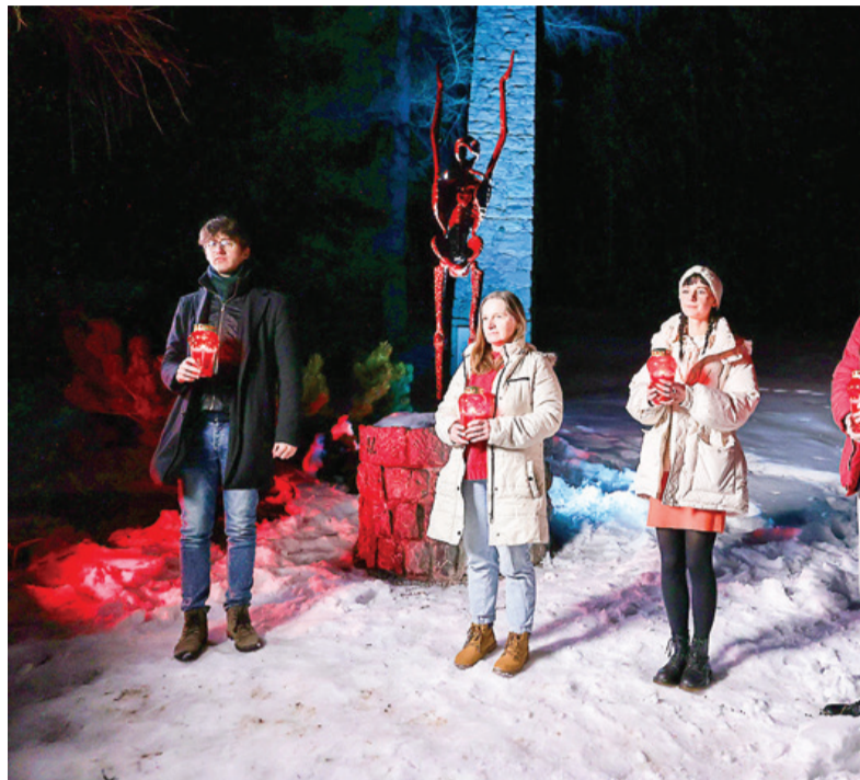
Del spletne prireditve so posneli tudi v spominskem parku na Ljubelju.

Koordinacijski odbor žrtev vojnega nasilja pri ZZB za vrednote NOB Slovenije je na predvečer mednarodnega dneva spomina na holokavst pripravil posebno spletno slovesnost. Bila je na ogled na Facebooku in YouTubeovom kanalu ZZB za vrednote NOB ter na programu TV Medvode.