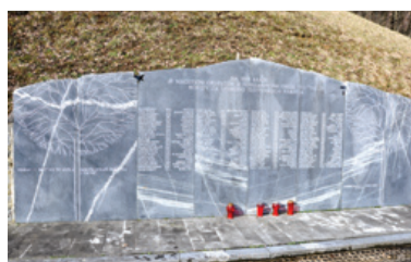
Spomenik frankolovskim žrtvam

12. februarja 1945 so nacisti v Frankolovem obesili devetindeset talcev, enega pa ustrelili kot maščevanje za smrt