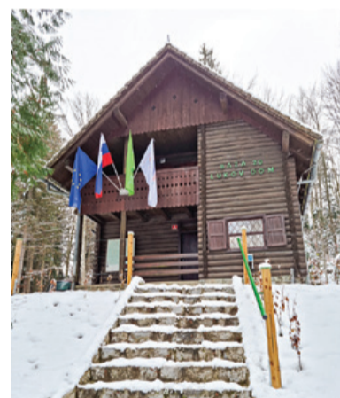
Lukov dom - vstopna točka v Bazo 20

Z začrtanim upravljanjem Baze 20 bo ta ohranjena za prihodnje