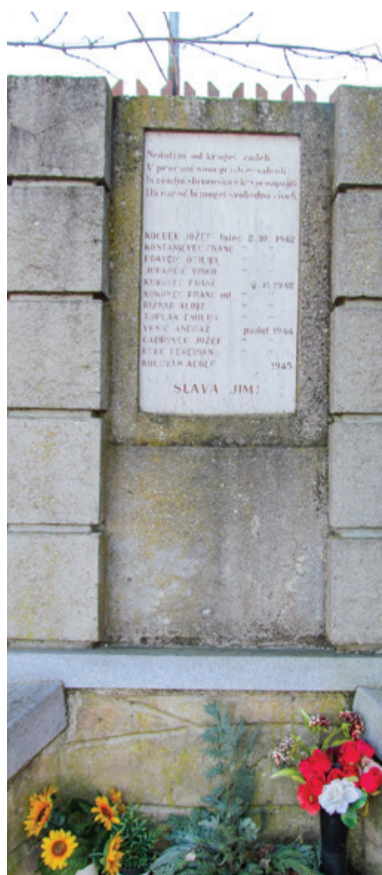
Spomenik žrtvam vojne 1941–1945 v Vitomarcih iz leta 1959