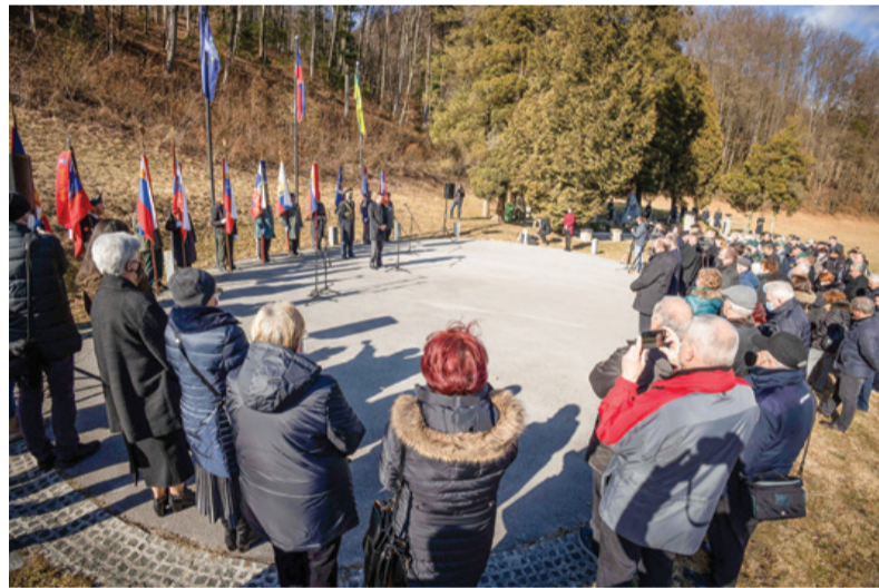
Na letošnji spominski slovesnosti je zbrane nagovoril predsednik RS Borut Pahor, ki je položil tudi venec k spomeniku.

obešati talce, pri čemer je bilo na posamezna drevesa obešenih tudi do pet ljudi. Krvavo početje je trajalo skoraj tri ure in se je končalo okoli poldneva. Talci so viseli do 14. ure, vse dokler niso za to določeni zaporniki izklopali dveh grobov. Obešene so sneli, slekli in sezuli ter jih nato zagrebli vanju. Ko govorimo o številu žrtev, je treba povedati, da je bil eden izmed talcev ustreljen na begu, enega, čigar ime sicer je na seznamu, pa so čez dva dni gestapovci ubili v Celju. Ali je bil namesto njega na Stranica obešen kdo drug, ni znano. Obešenih je tako bilo najverjetneje 98 talcev, kar pa seveda ne spre-