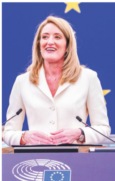
Roberta Metsola

V nadaljevanju svojega pisma so poslanci predsednici Evropskega parlamenta predstavili zgodovino fašističnega terorja nad Slovenkami in Slovenci ter pomen preseganja razlik in krepitve sodelovanja med Slovenijo in Italijo v Evropski uniji.