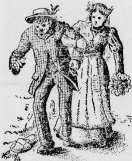
»En kozarček al' pa dva...«

»En kozarček al' pa dva, to nam korajžo da.«