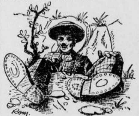
»Jaz nisem zapustil Francke...«

»Vetrnjak, ne bodi tako nasilen. Midva se ne bova prepirala in si skočila v lase. Poniziva se in pobotajva in pojdiva v gostilno, morda na tleva tam izkubijeno stvar.«