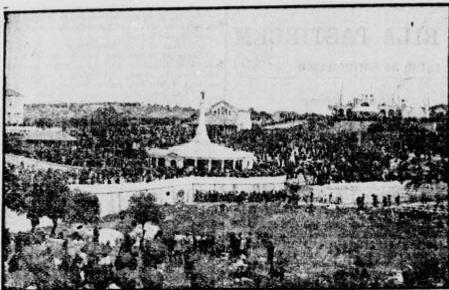
Pogled na ves prostor: V sredini vidimo obzidan studenee, na vrhu je kip Srca Jezusovega. Na levi strani vidimo bolnišnico, onstran studenea je kapela za spovedovanje, na desno v gornjem kotu pa se vidi mogočno zidovje nove cerkve. (Slika iz leta 1934.)

glavnih skrivnosti, ki se tičejo vseh ljudi, je Lucija prvi dve čez nekaj let povedala, tretje pa doslej še ni razodela. Pri tej priliki je Gospa Luciji naročila, naj se nauči brati in pisati, da bo njena mesečna naročila sproti lahko zapisovala in shranila. Ob koncu prikazni je Gospa, kar so videli vsi trije otroci, odprla svoje roke, nakar se je nanje