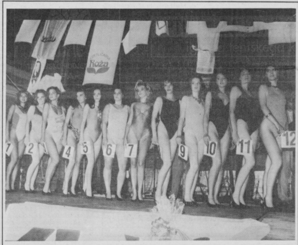
Dvanajst lepotic se je Ptujčanom predstavilo trikrat. Najbolj so navdušile v kopalkah.

Dekleta so ptujске organizatorje pohvalile, saj so v resnici poskrbeli za vse, da so se pred tekmovanjem in tudi po njem dobro počutile. Brezplačno so jim zagotovili frizerske storitve v salonu Dragica in v kozmetičnem salonu Artemis v hotelu Mitra. Na nastop so se pripravljale v sobah hotela. Pred izbiro smo se pogovorili z vsemi