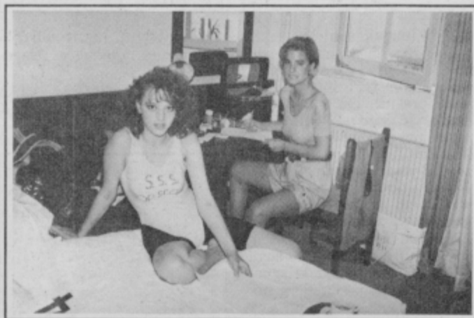
Običajni klepet lepotic v hotelski sobi. Katera od njih bo zmagovalka?