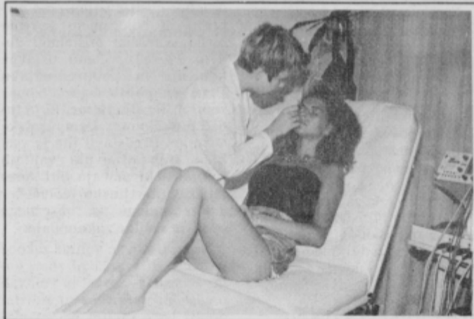
V kozmetičnem salonu Artemis so jih naličili in še bolj poudarili njihovo lepoto