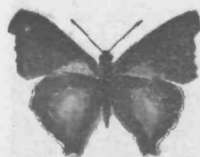
Iz risb idrijskih realcev.