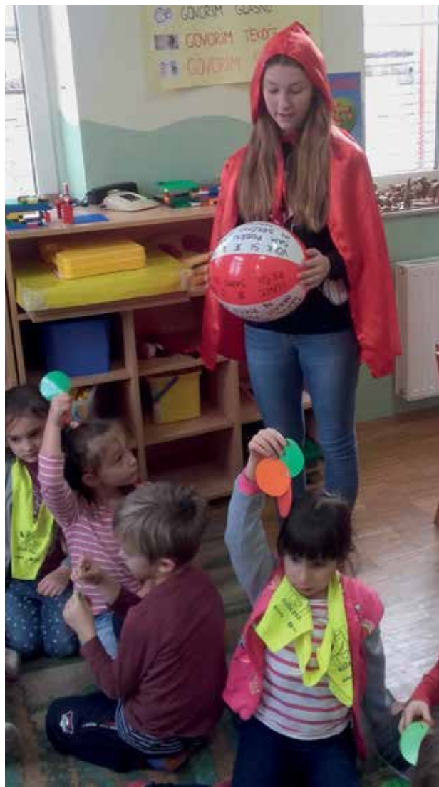
Slika 1: Obisk Rdeče kapice.

Na napihljivi žogi so bile zapisane trditve o Rdeči kapici. Izbrali smo učenca, ki je zakotalil žogo. Na tistem mestu, kjer se je žoga ustavila, je učenec prebral zapisano trditev. Pri branju mu je pomagala Rdeča kapica. Če je bila trditev o Rdeči kapici pravilna, so učenci dvignili zelen kartonček na semaforju, če je bila trditev napačna, so dvignili rdečega, če pa odgovora niso poznali, so dvignili oranžnega. Učenci so pri vsaki trditvi povedali, zakaj se s trditvijo strinjajo ali zakaj ne. Na takšen način sem preverila njihovo razumevanje pravljice.