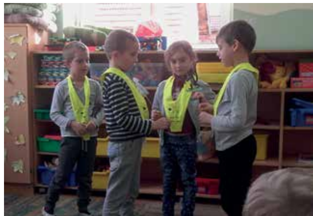
Slika 4: Uprizoritev pravljice.

Učence sem razdelila v heterogene skupine (dve skupini po sedem učencev in dve skupini po šest učencev). Pri razdelitvi v skupine sem upoštevala želje učencev glede na to, katero vlogo želijo igrati. Podala sem navodila za delo v skupinah. Enemu učencu v skupini sem dodelila vlogo opazovalca, ki bo spremljal uprizoritev pravljice. Na koncu bo podal predloge, kako bi lahko ostali