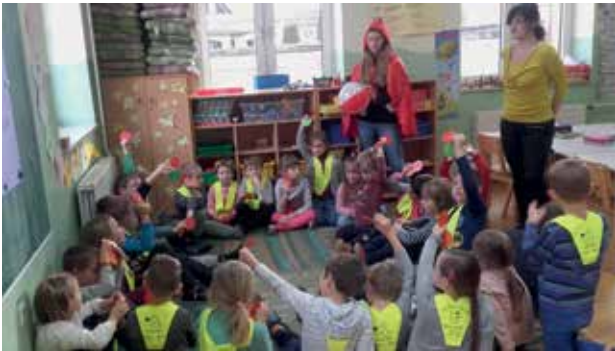
Slika 2: Preverjanje predznanja.

trditvah skoraj vsi odločili za ustrezno barvo kartončka in ga dvignili. Nekateri učenci so tudi povedali, zakaj se s trditvijo strinjajo in zakaj ne. Preverjanje njihovega predznanja mi je bil pokazatelj, da lahko nadaljujem z učnim procesom, saj se je izkazalo, da imajo veliko potrebnega znanja o vsebini pravljice. To znanje so kasneje potrebovali pri uprizoritvi pravljice.