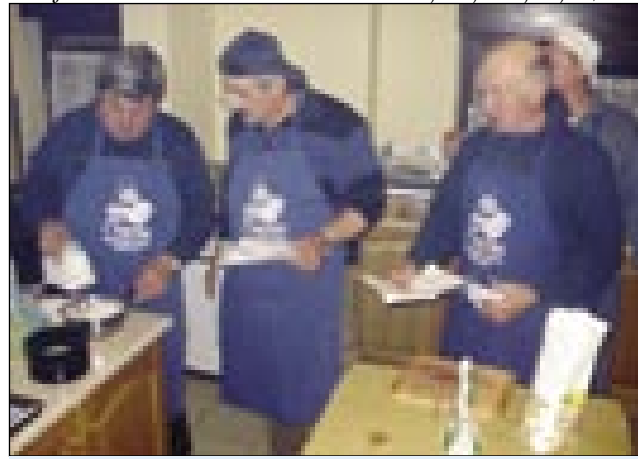
»Veja s tauga nikak nešče snejg biti«

• Kak se odlaučijo, sto ka de küjo, gda menü v rokau dobijo?