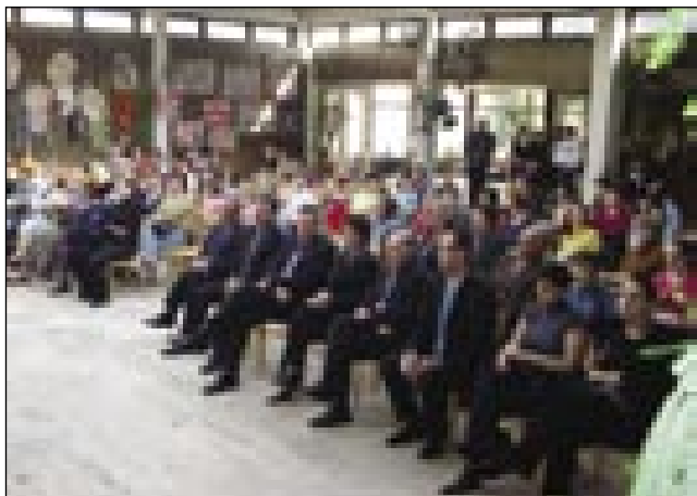
Avla monoštrske šole se je napolnila z gosti, starši, starimi starši, malčki in učenci

V četrtek, 2. aprila, je v avli Osnovne šole Istvána Széchenyija, z začetkom ob 16.