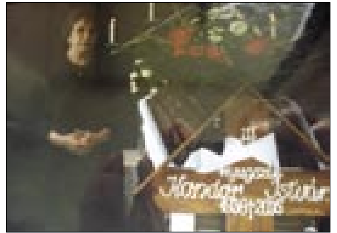
Pokopala sam drugoga moža tö

Za pet lejt se je pokazalo, ka 22 lejt sejdati v kamioni je nej zdravo. Njegve nogé so več nej takšne bile, kak bi mogle biti.