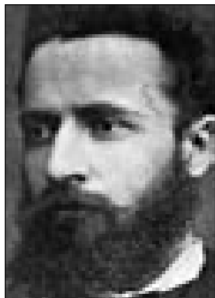
Najveksi bolgarski pesnik Hristo Botev

»Ne vpelaj nas vu sküšavanje,« - pravijo Bolgari, gda molijo Očanaš v svojoj pravoslavnoj cerkvi svetoga Cirila in Metoda v Budimpešti. Zidino so sami zozidali leta 1931 pa je eške gnes edna