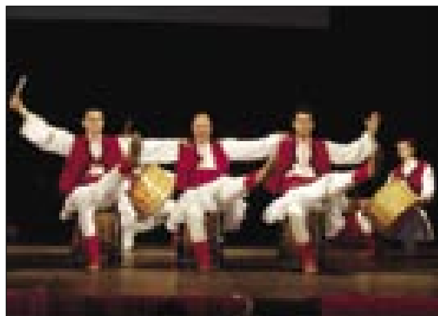
Folklorna skupina Martenica

Če so se rejsan Bolgari vkraj držžali od neprijetalov Habsburški casarov, so v revoluciji leta 1848 stanili na stran madžarskoga naroda. Dosta