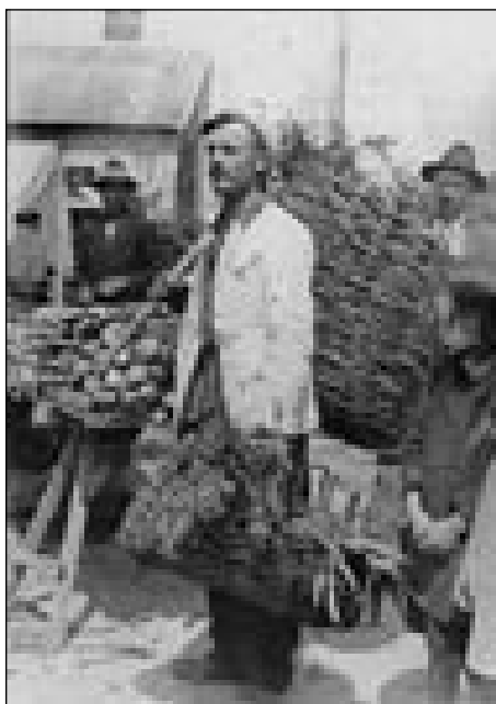
Bolgarski vrtnar v Tiszafüredi (1937)

je je v vojsko nutstaupilo, civilno bolgarsko lüstvo pa je pomagalo sodakom z gvanti, penezami, krmov. Avstrijci so deset Bolgarov na smrt