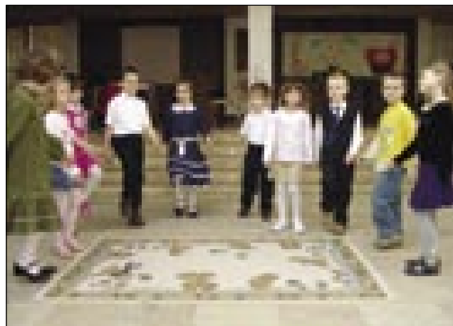
Nastop monoštrskih malčkov

Nakoncu prireditve so si udeleženci lahko ogledali razstavo, ki so jo s fotografijami o raznih šolskih oz. zunajšolskih