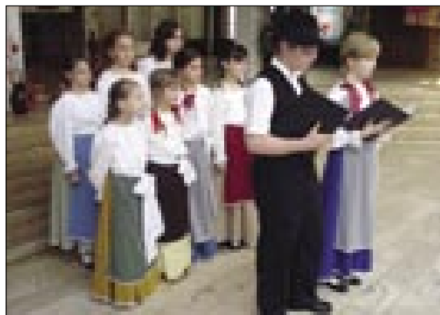
OŠ Števanovci se je predstavila s pesmimi in plesi

Dopoldne je v Slovenskem kulturnem in informativnem centru potekal drugi delovni sestanek Krovne šolske ko-