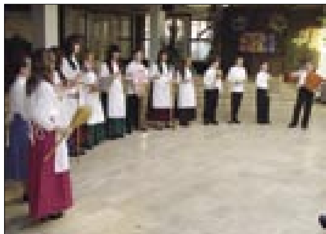
Veseli učenci gornjeseniške šole

dama mostovi (hidak) in pa ne vem (nem tudom) , s katerima je zaželela, naj si ustvarjamo čim več mostov in naj bi bilo v naši komunikaciji čim