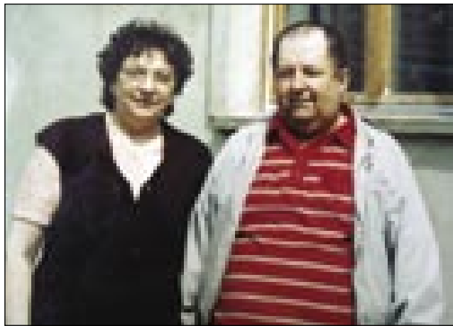
Z drugim možaum že doma v Sakalauvca

'Nemo duže delo ranč eden den nej, končam. Telko lejt sejdati v kamioni, mi je dojšlo. Moje čonte so trde, zdaj ščem živati, ka mo po svoji nogaj ojde pa je nüco. Šli mo tanazaj v našo rojstno ves, pa mo tam živali tak dugo, kak nam Baug dá.' Doma v Sakalauvca je naš ram že gotovi bijo, v Meriki smo vse vred djali,