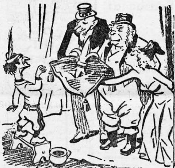
... IN ZADNJA