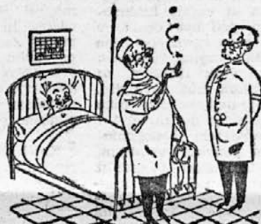
— Torej, če bo cifra, operiramo, če bo grb pa ne!

ko, kot je kupil Glista tisti svoji debeloglavi in krivonogi Miri iz komerciale nov šal!«