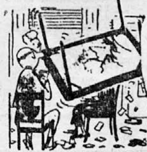
— Jaz pa kljub temu pravim: pik je bil adu!