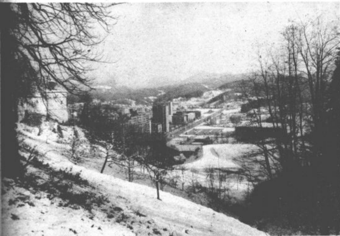
Velenje v prvem snegu