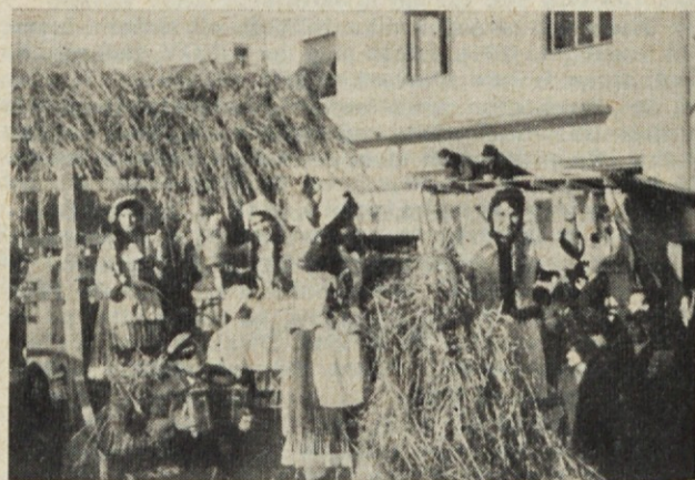
Žanjice v pestrih slovaških narodnih nošah