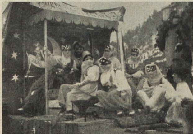
Harem v karnevalski povorki leta 1963

V lanskoletni karnevalski povorki je sodeloval naš kolektiv s skupino, ki je predstavljala harem in pre-jela tudi tretjo nagrado. V letošnji povorki pa sta sodelovali kar dve skupini, in sicer skupina ciganov in deklet v slovaških narodnih nošah.