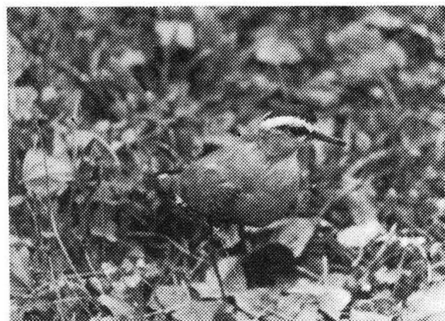
12. Nagačen primerek stepske pribe Chettusia gregaria iz Št.Vida na Dolenjskem z leta 1967 (I.Božič)

11. A specimen of the Sociable Plover Chettusia gregaria observed on Ljubljana Marsh on 2.4.1983 (D.Černe)