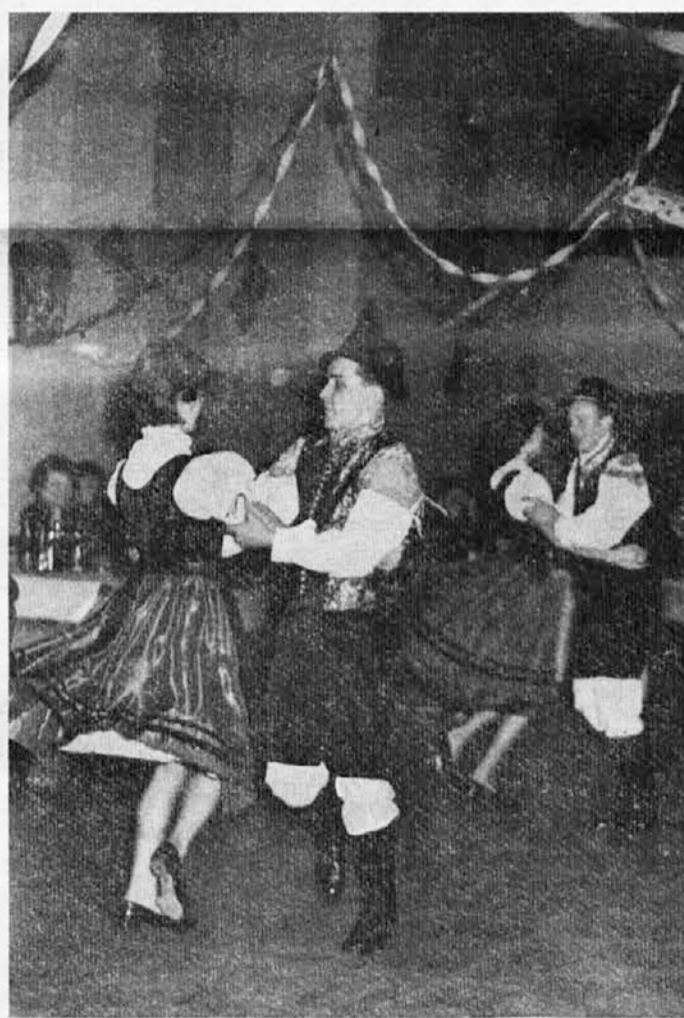
ZABAVNI VEČER »METULJČKOV LET«: VESELO RAJANJE FOLKLORNE SKUPINE