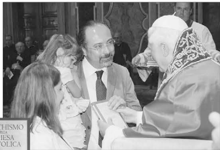
CATECHISMO DELLA CHIESA CATTOLICA Compendio

V torek, 28. junija, je papež Benedikt XVI. v vatiškani dvorani Clementini predstavil javnosti povzetek katekizma katoliške Cerkve. Vse govori o tem, da knjiga želi najti pot med čimveč bralci, saj bodo žepno izdajo prodajali tudi v marketih, na letališčih in avtocestnih počivališčih. Besedila primer-no dopolnjuje tudi 15 barvnih reprodukcij podkovan- no izbranih umetniških del od paleokrščanskih mozaikov do El Greca, v dodatku pa je vsebovan izbor molitev bodisi v latinščini bodisi v prevodu. Sam papež je pozval vernike, naj se naučijo tudi izvornih, latinskih obrazcev, tako da bodo lažje skupno molili z verniki različnih jezikov. Ker uradni katekizem šteje nič manj kot 900 strani, so se odločili za izdajo, ki na 170 straneh s pomočjo 598 vprašanj in odgovorov nazorno opredeljuje cerkveni nauk. Obravnavane so najrazličnejše teme, od dostojanstva osebe in pravice do življenja prek vojne in miru pa vse do spolnosti in številnih drugih vidikov vsakdanjega bivanja. Na predstavitvi je sveti oče izročil po en izvod dvanajstim "kategorijam" vernikov; med temi so bili kardinal, škof, duhovnik, redovnik, redovnica, družina z otrokom, dva mlada