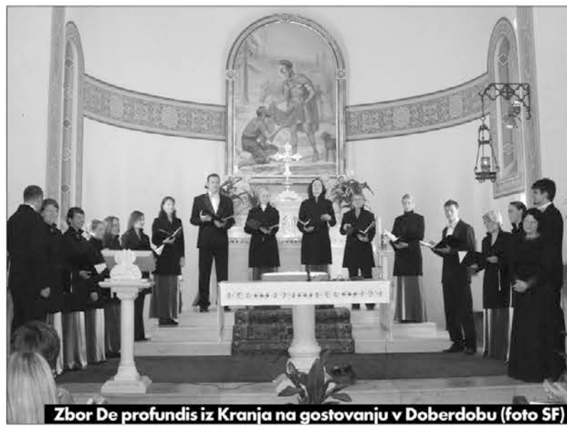
Zbor De profundis iz Kranja na gostovanju v Doberdobi (foto SF)

veda nastop kranjskega komornega zbora De profundis. Gre za kakovosten pevski sestav, ki je bil ustanovljen leta 1990. Od same-