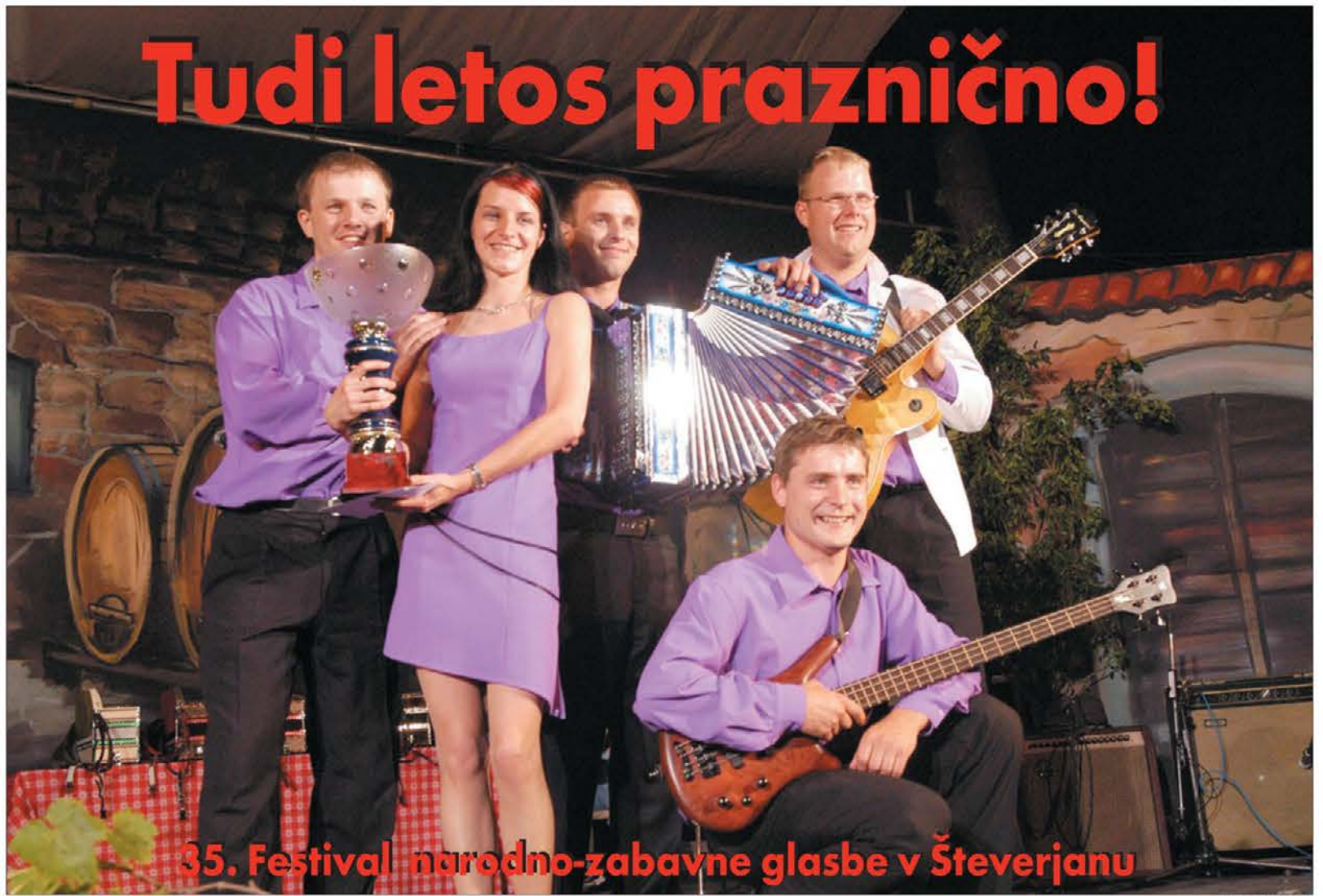
35. Festival narodno-zabavne glasbe v Števerjanu

Za to je šlo pri največjem koncertu vseh časov, prav za to in ne za razkazovanje gub in let ostreljih rock pevcev. Za boj proti revščini gre! Dejstvo, da je italijanska država vzela davek IVA od vsakega evra, ki smo ga preko telefonskih klicev poslali za revne v svetu, pa govori o tem, koliko poti bo še potrebno prehoditi, da bo solidarnost postala zares planetarna. Taka, kot je bila v soboto rock in pop glasba!