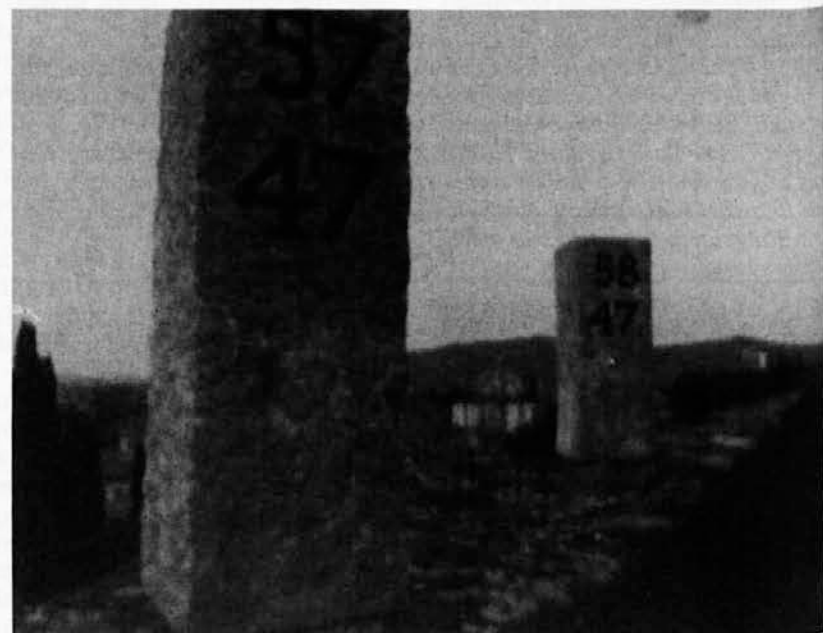
Posnetek iz Jarčevega filma »Sejem pripadnosti«, s katerim se bo pričel 7. Film Video Monitor