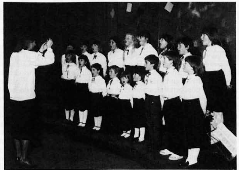
Prvi otroški pevski zbor Slovenskega kulturnega društva »Vigred« iz Šempolaja

V preteklosti je SKD »Vigred« prirejalo tudi šagre, vendar to od leta 1986 ni več mogoče zaradi novih norm za ureditev prireditve-