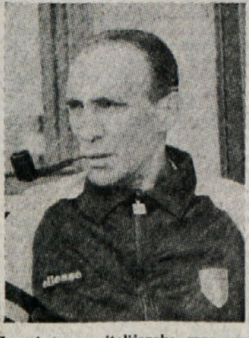
Zvezni trener italijanske reprezentance Enzo Bearzot bo do skorajšnjega pričetka SP moral rešiti še obilico problemov v svoji postavi

Ob zrebu za sestavo skupin januarja letos so vsi menili, da bo I. skupina, v kateri igra Italija in Poljska, najlažja. Vendar se je sedaj izkazalo, da najbrž ni tako. Italijani igrajo v zadnjem času v slabih formah, tako da bi se znal v boj za napredovanje vrniti tudi Peru.