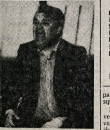
Jugoslovanski zvezni trener Miljan Miljanic

Zal, pa so vzdružili v reprezentanci skalile polemike v zvezi z afero glede podpisa pogodbe reprezentantov z dvema tvrdkama, ki proizvajata nogometne čevlje. Miljanic pa je imel tudi težave zaradi poškodb nekaterih nogometašev (Zajec, Zlatko Vujović itd.).