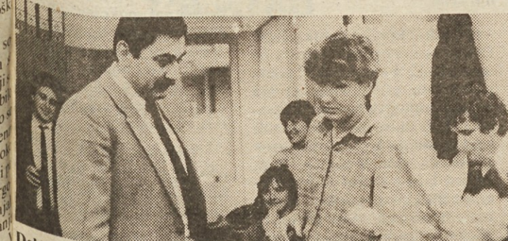
Dekleta deviznega oddelka so priredila skromno slovesnost ob odhodu iz tozda Inženiring.